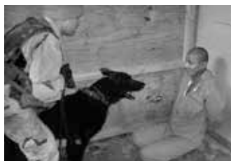
Es gibt sehr viele Methoden, Geständnisse zu erzwingen.

zás „életet ment“ és „jelentős információkkal“ szolgál „a terrorizmus elleni harcban“, azt éveken keresztül csak a CIA állította a kormánnyal, főfelügyelőivel és a sajtóval szemben, melyek ezeket az állításokat hitelességük megkérdőjelezése nélkül tovább terjesztették. A félrevezetési taktikában megint az a személy