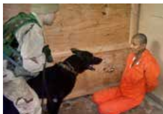
Es gibt sehr viele Methoden, Geständnisse zu erzwingen.

Mind a történelmi visszatekintésben, mind a most megjelent titkos jelentésben világossá válik, hogy Abu Ghraib után a liberális vitában szintén felmerülő, a kínzást legitimáló gyakran említett példa a fogva tartott terroristánól és a ketyegő bombáról – nem lehet senkinek az ellen kifogása, hogy megkínózzunk egy embert, ha százak életét lehet ezzel megmenteni – nem több egy alattomos trükknél, hogy eloszlassák a kínzással