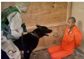
Es gibt sehr viele Methoden, Geständnisse zu erzwingen.

zás „életet ment“ és „jelentős információkkal“ szolgál „a terrorizmus elleni harcban“, azt éveken keresztül csak a CIA állította a kormánnyal, főfelügyelőivel és a sajtóval szemben, melyek ezeket az állításokat hitelességük megkérdőjelezése nélkül tovább terjesztették. A félrevezetési taktikában megint az a személy