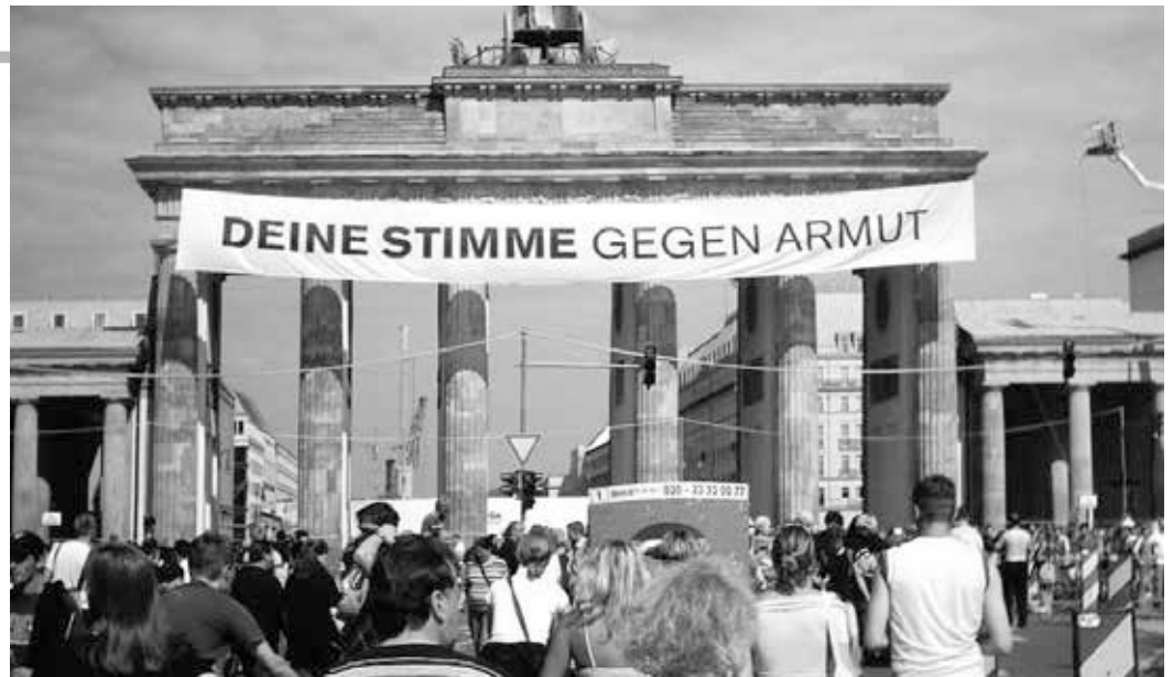
Brandenburger Tor während des Live-8-Festivals in Berlin

Mit dem Sturz der hawaiischen Königin Anfang 1893 kann man dann den Beginn des bis heute anhaltenden Ausgreifens über den eigenen Kontinent hinaus markieren, auch wenn Präsident Harrisons Nachfolger Cleveland den Anschluss Hawaii an die USA noch ablehnte. Und nach dem „lovely little war“ gegen Spanien 1898, das den USA die Herr-