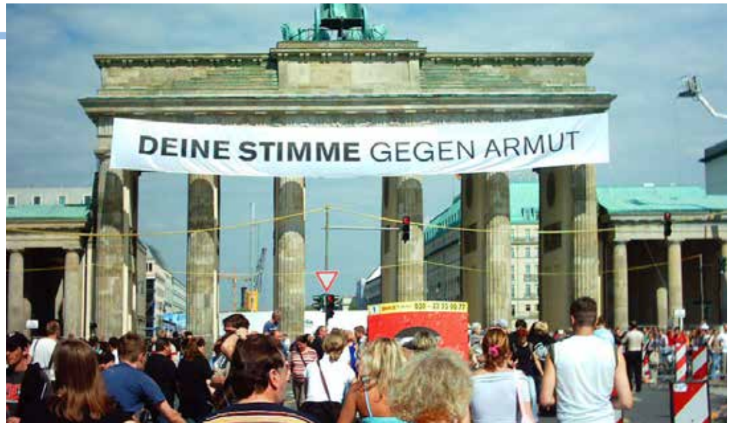
Brandenburger Tor während des Live-8-Festivals in Berlin

Mit dem Sturz der hawaiischen Königin Anfang 1893 kann man dann den Beginn des bis heute anhaltenden Ausgreifens über den eigenen Kontinent hinaus markieren, auch wenn Präsident Harrisons Nachfolger Cleveland den Anschluss Hawaii an die USA noch ablehnte. Und nach dem „lovely little war“ gegen Spanien 1898, das den USA die Herr-