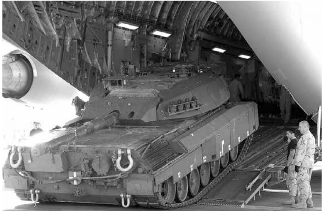
Können die Gewinnerwartungen amerikanischer Globalkonzerne sich auch ohne Kriege umzusetzen?

Das naßforsche Verhalten deutscher Generale bei NATO-Übungen an der russischen Grenze macht deutlich, was den Deutschen und anderen Europäern droht, wenn ihre Streitkräfte über militärtechnische Tricks den eigenen Parlamenten und damit Regierungen entzogen werden und auf amerikanischen Befehl hin verlegt werden. Fünfundzwanzig