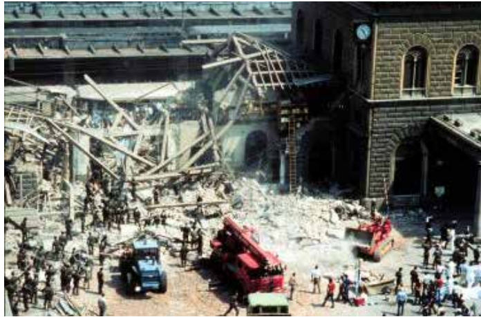
1980: der zerstörte Hauptbahnhof von Bologna - die Serie von Terroranschlägen in den 70er und 80er diskreditierte die italienischen Kommunisten und verbreitete maximale Angst unter der italienischen Bevölkerung, da niemand wirklich wusste, was los war und wer als nächstes getötet werden würde.

Peteano war in Italien keine isolierte Tragödie, sondern Teil einer langen Reihe von Terroranschlägen, die im Jahre 1969 begonnen hatte. Am 12. Dezember jenes Jahres explodierten auf öffentlichen Plätzen in Rom und Mailand vier Bomben, die 16 unschuldige Zivilisten töteten und 80 Personen verstümmelten und verwundeten, wobei es die meisten Toten und Verletzten auf dem Mailänder Piazza Fontana gab. Nach dem Massaker platzierte der italienische Militärgeheimdienst SID nach den Regeln der Strategie der Spannung Bombenteile in der Villa des bekannten linken Verlegers Giangiacomo Feltrinelli, um die Kommunisten und andere Mitglieder der extremen Linken des Terrors zu beschuldigen. Erst Jahre später wurde bekannt, dass Feltrinelli absolut gar nichts mit dem Verbrechen zu tun hatte und dass in Wirklichkeit die italienischen