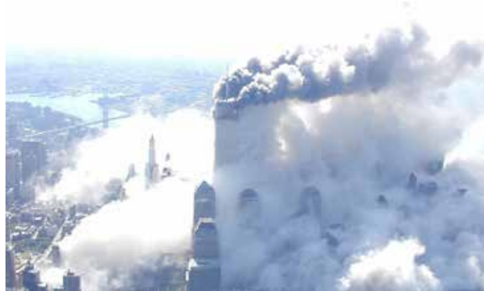
New York, 11. September 2001

che Zeit und Energie investierten und sich zusätzlich durch die 339 Seiten von Griffins Kritik pflügten, waren zutiefst beunruhigt.