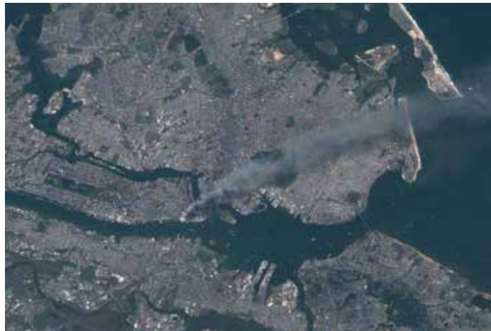
Rauch über New York am 11. 9. 2001

h) Nur wenn ein in Serie geschaltetes Explodieren der Stützpfeiler, in exaktem Abstand, die einzelnen Stockwerke zu Fall gebracht hätten und die Stockwerke sich nicht gegenseitig berührten, oder aufeinander fielen, ist es überhaupt möglich, dass die Türme in nahezu Freifallgeschwindigkeit zu Boden kamen. Es gibt keinerlei Alternativerklärung in der Physik, ohne dass nicht gleichfalls