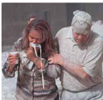
Staubbedeckte Überlebende.

3. Dadurch dass die drei Gebäude fast wie im freien Fall einstürzten, lässt sich schließen, dass bei allen drei Gebäuden zufälligerweise die Grundpfeiler der Gebäude, also die Hauptlast tragenden Pfeiler, in exakter Reihenfolge, von oben nach unten, geschwächt wurden. Denn nur dadurch konnten die Gebäude überhaupt einstürzen. Thermit ist dafür hervorragend geeignet. Nachdem die Pfeiler quasi in Serie geschwächt (gesprengt) wurden, mussten Sprengungen die anderen Pfeiler so durchtrennt haben, dass die Gebäude in sich einstürzten. In der Natur kommt ein in Serie einfallendes Einstürzen nicht vor. Das bedeutet, dass die Pfeiler zeitgleich auf jedem Stockwerk, Etage für Etage, aufeinander abgestimmt, durchtrennt worden sein mussten, sodass das Gebäude auf seinem Weg nach unten auf fast keinen Widerstand traf.