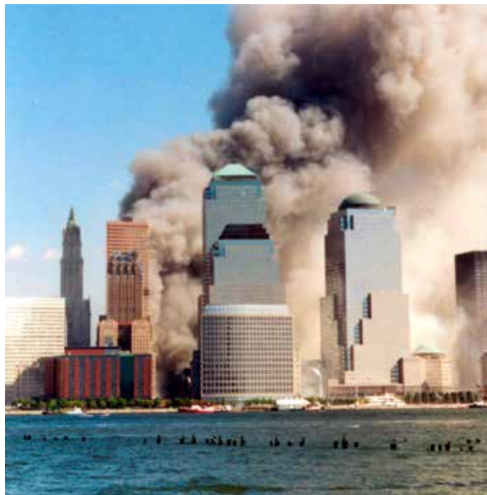
Die Türme sind kollabiert.

4. ›Pyroklastischer Strom‹ besteht aus Staub und Asche. Er wirbelt nach den Einstürzen der Gebäude mit einer Geschwindigkeit von 56 km/h durch New York. Ein solcher Strom hat seiner Zeit Pompeji zerstört. Um so eine Ge-