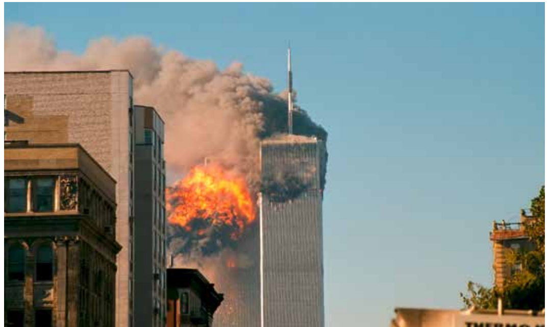
UA Flug 175 trifft den WTC Südturm am 11. September 2001