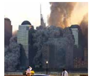
Blick vom Hudson River.