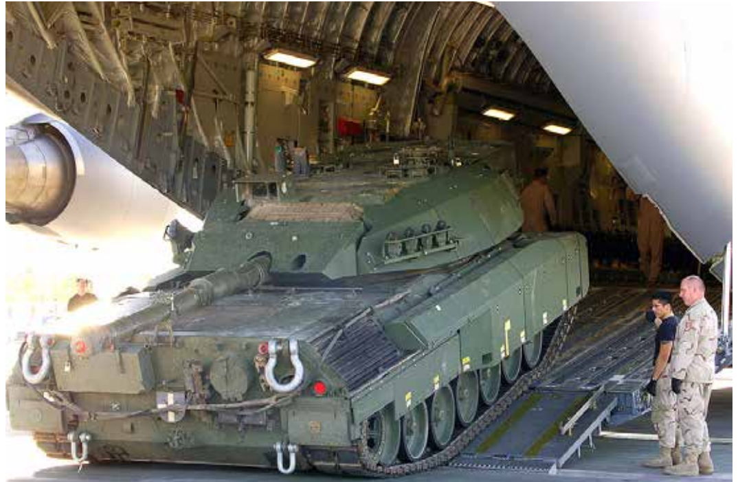
Können die Gewinnerwartungen amerikanischer Globalkonzerne sich auch ohne Kriege umzusetzen?

Das naßforsche Verhalten deutscher Generale bei NATO-Übungen an der russischen Grenze macht deutlich, was den Deutschen und anderen Europäern droht, wenn ihre Streitkräfte über militärtechnische Tricks den eigenen Parlamenten und damit Regierungen entzogen werden und auf amerikanischen Befehl hin verlegt werden. Fünfundzwanzig