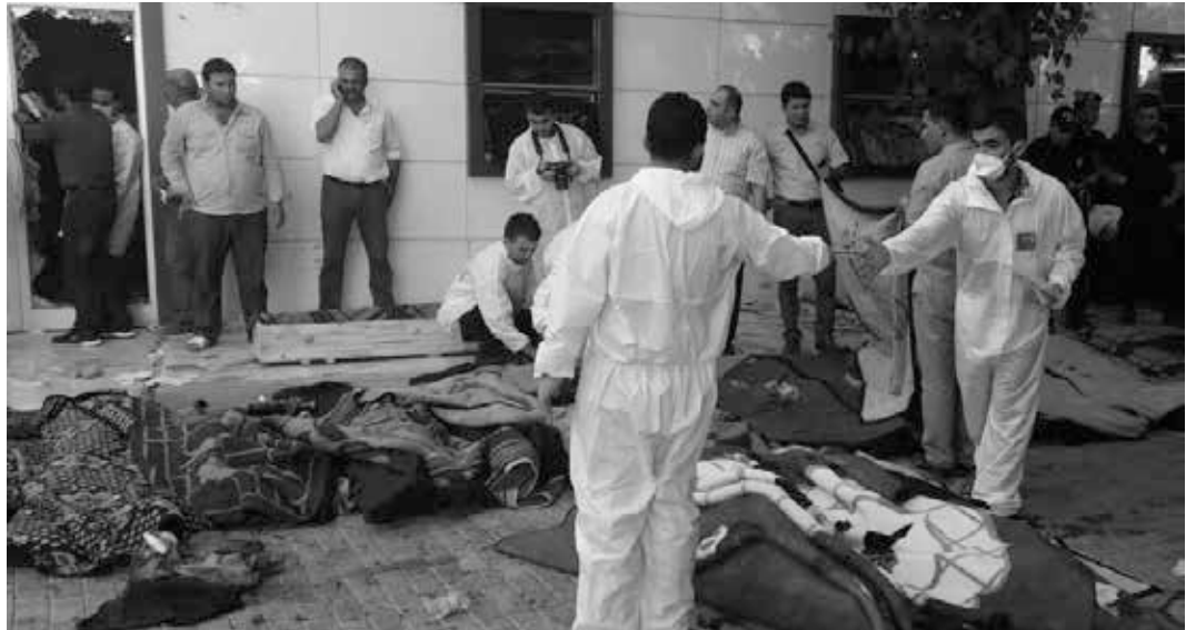
Forensische Experten nach dem Anschlag am Tatort in Suruç.

bane angriff, hinderte die Türkei den Nachschub und die humanitäre Hilfe für die kurdischen Verteidiger und ließ die IS-Angreifer gewähren. Ankara verweigerte den USA die Nutzung des viel näher gelegenen türkischen Flughafens Incirlik für ihre Kampfflugzeuge gegen die Truppen des IS, wohl wissend, dass die Schlagkraft der US-Jets von fernen Flugzeugträgern aus erheblich geschwächt würde. Dabei gehören die Türkei wie auch die USA der NATO an. Ankara nahm also mit seiner Politik bewusst einen Konflikt mit den USA auf.