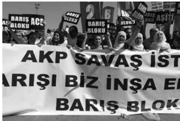
Anti-AKP-Transparent um gegen den Anschlag von Suruç zu demonstrieren

Dem türkischen Vormachtstreben stand und steht auch entgegen, dass die USA ein islamistisches Herrschaftsgebiet mit weit ausstrahlender Dynamik bis in andere Regionen (z. B. Afrika) offensichtlich nicht hinnehmen wollen, wie ihr militärischer Einsatz in Irak und Syrien zeigt. Dabei stützen sich die USA auf kurdische Kräfte in Irak und Syrien, die gegen den IS als Bodentruppe der USA kämpfen und damit tendenziell aufgewertet werden. Das stärkt in der Türkei – ob zu Recht oder zu Unrecht – die Befürchtung, die Kurden könnten näher zusammenrücken und separatistische Bestrebungen sich verstärken. In diesem Zusammenhang lassen sich die jüngsten Luftangriffe auf das Gebiet von Rojava, dem kurdisch-syrischen Autonomiegebiet, erklären. Es soll keine kurdische Selbständigkeit in Syrien entstehen. Gleichzeitig könnte zu einem