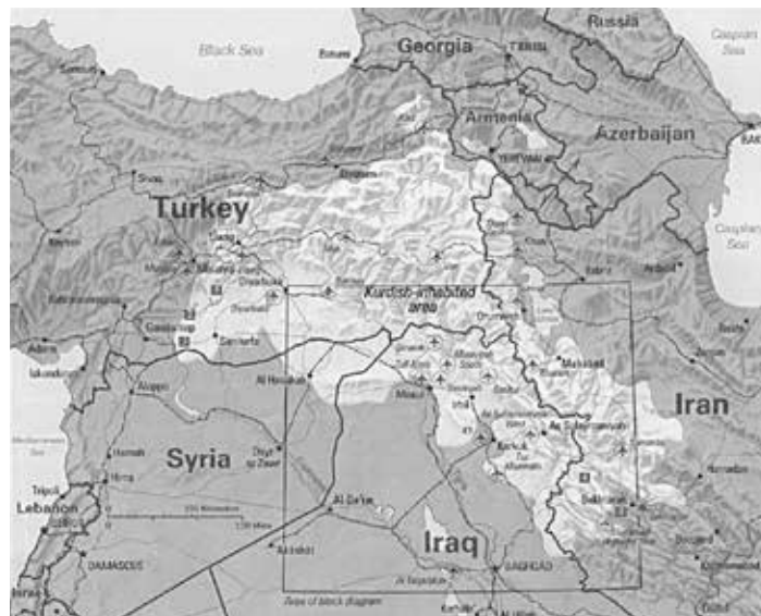
Von Kurden bewohnte Gebiete. (Karte: CIA, Wikipedia/gemeinfrei)

den irakisch-kurdischen Kandilbergen und die korrespondierenden Diffamierungen aus Ankara dürften nur die Begleitmusik zu der Beendigung des angeblichen Friedensprozesses sein. Die USA waren bereit, im Austausch für die