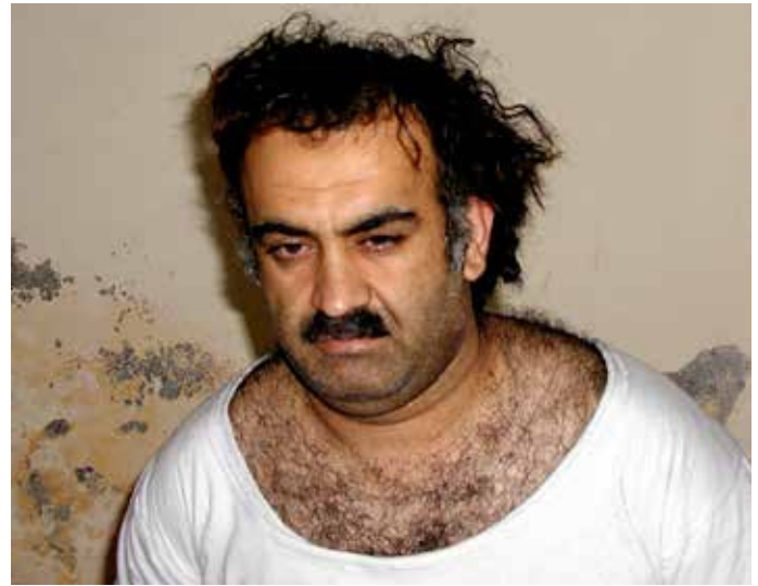
Chalid Sheik Mohammed (kurz KSM)

Yosri Fouda ist jeden Beweis schuldig geblieben, dass sein Interview mit KSM tatsächlich stattgefunden hat. Versprochene Videoaufnahmen hat der Al Jazeera-Journalist bis heute nicht geliefert. Zudem herrscht Verwirrung über den Zeitpunkt des Interviews. Fouda hat seine diesbezüglichen Aussagen