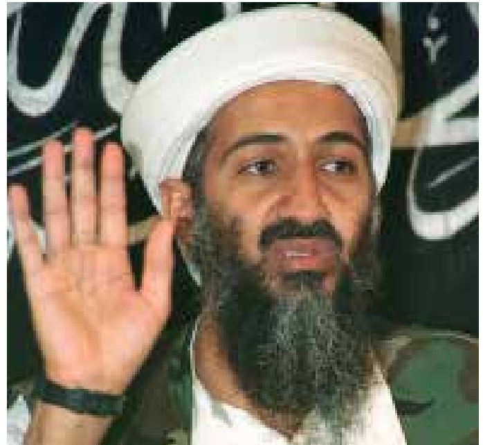
Osama bin Laden

Zu kaum einem Thema im ganzen Fall 9/11 gibt es so wenig überprüfbares Material wie bezüglich Osama