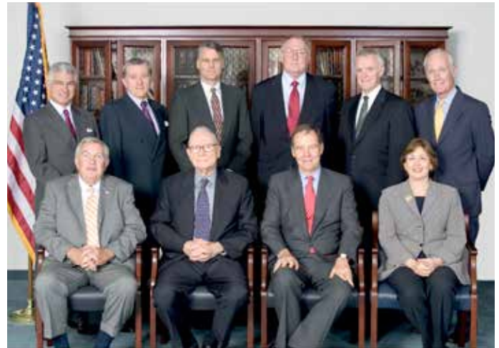
Die «National Commission on Terrorist Attacks Upon the United States», wie die 9/11-Kommission schliesslich mit vollem Namen hiess, bestand aus fünf Republikanern und fünf Demokraten, alle (indirekt) ausgewählt von US-Präsident George W. Bush und Tom Daschle.

Die Ausgangslage war also denkbar schlecht, um das erklärte Ziel der Kommission – «to provide the fullest possible account of the events surrounding 9/11» – zu erreichen: viel zu kleines Budget, viel zu wenig Zeit, abhängige Kommissionsmitglieder und ein Executive Direktor mit engsten Verbindungen