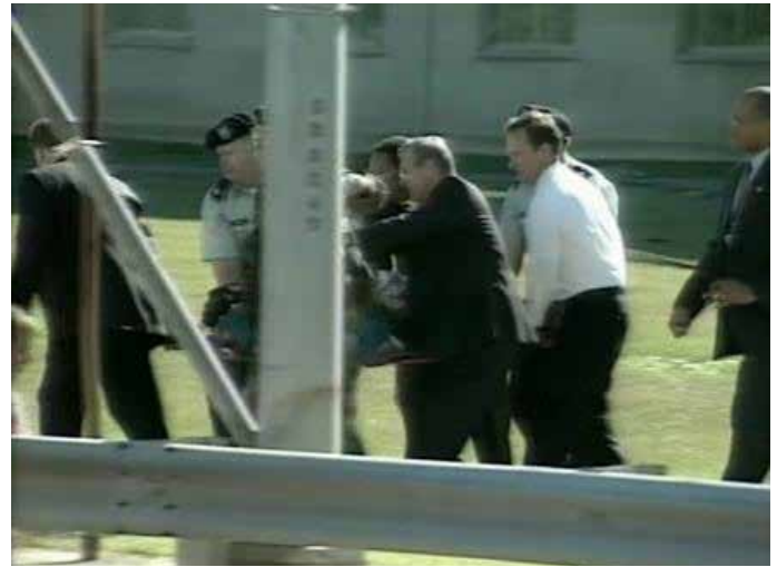
Um 9.38 Uhr spazierte Rumsfeld zur zirka 8 Minuten entfernten Unfallstelle, half Sanitätern, liess sich fotografieren – und war für das verzweifelt nach ihm suchende National Military Command Center unauffindbar.

Als AA77 um 9.38 Uhr ins Pentagon donnerte, begab sich Rumsfeld nicht etwa endlich ins NMCC (das sich gleich am Ende des Flurs befindet), sondern spazierte zur zirka 8 Minuten entfernten Unfallstelle, half Sanitätern, liess sich fotografieren – und war für das verzweifelt nach ihm suchende NMCC unauffindbar. Erst kurz vor 10 Uhr kehrte Rumsfeld in sein Büro zurück, telefonier-