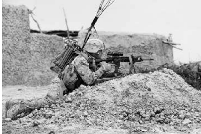
US-Marine mit Heckler & Koch M27 Infanterie Automatic Rifle in der Nähe von Khan Neshin in Afghanistan, März 2012

Und noch ein schier unglaublicher Deal des Bundesausfuhramtes und des Bundeswirtschaftsministeriums mit Heckler & Koch: Im Jahr 2007, als bereits G36-Sturmgewehre in großer Zahl illegal in Unruheprovinzen gelangt waren, benötigte die mexikanische Polizei aufgrund des dortigen Waffeneinsatzes mehr Ersatzteile. H&K forderte die Genehmigung an und erhielt Sonderkonditionen: Der zuständige BMWi-Resortleiter, Ministerialrat Claus W. urteilte: „... die Argumentation von H&K ist in der Tat überzeugend – daher keine Bedenken im Fall von H&K den Wert auf 30 % hochzusetzen“. Heckler & Koch sollte jedoch dazu verdonnert werden, diese Einzelfallentscheidung „nicht im großen Kreis hinauszuposaunen“. Ohne dass eine weitere Diskussion in den zuständigen Behörden stattgefunden hätte, wurde schließlich die „Lex Heckler & Koch“ schriftlich im Dezember 2007 genehmigt und abgezeichnet. Eine spätere Verlängerung um weitere drei Jahre wurde gleichsam bewilligt. Diese E-Mail-Korrespondenz, die uns wie viele weitere vorliegt, ist ein