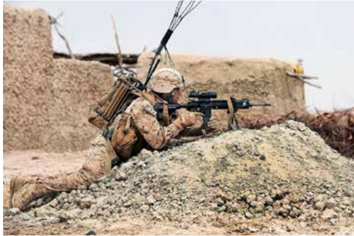
US-Marine mit Heckler & Koch M27 Infanterie Automatic Rifle in der Nähe von Khan Neshin in Afghanistan, März 2012

Und noch ein schier unglaublicher Deal des Bundesausfuhramtes und des Bundeswirtschaftsministeriums mit Heckler & Koch: Im Jahr 2007, als bereits G36-Sturmgewehre in großer Zahl illegal in Unruheprovinzen gelangt waren, benötigte die mexikanische Polizei aufgrund des dortigen Waffeneinsatzes mehr Ersatzteile. H&K forderte die Genehmigung an und erhielt Sonderkonditionen: Der zuständige BMWi-Resortleiter, Ministerialrat Claus W. urteilte: „... die Argumentation von H&K ist in der Tat überzeugend – daher keine Bedenken im Fall von H&K den Wert auf 30 % hochzusetzen“. Heckler & Koch sollte jedoch dazu verdonnert werden, diese Einzelfallentscheidung „nicht im großen Kreis hinauszuposaunen“. Ohne dass eine weitere Diskussion in den zuständigen Behörden stattgefunden hätte, wurde schließlich die „Lex Heckler & Koch“ schriftlich im Dezember 2007 genehmigt und abgezeichnet. Eine spätere Verlängerung um weitere drei Jahre wurde gleichsam bewilligt. Diese E-Mail-Korrespondenz, die uns wie viele weitere vorliegt, ist ein