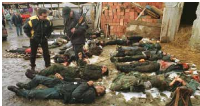
Der Leichenfund in Rugovo.

Und während er noch spricht, nähert sich von weitem ein Heli-