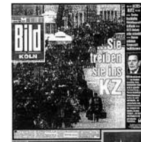
„Bild“, 1.4.99, „Sie treiben sie ins KZ“. Aus der Bildlegende: „KZ. Konzentrationslager. Ein Alptraum ist wiederauferstanden. Aus dem Kosovo verstärkten sich gestern Berichte, dass die Serben Tausende von Albanern in riesige Lager zusammenreiben ...“

Pristina, die Hauptstadt des Kosovo, war Schauplatz einer perfiden Propagandageschichte: Im Mittelpunkt stand das Fußballstadion. Rund um das Stadion sind die Zerstörungen bis heute zu sehen, und oben auf den Tribünen verwittert der Beton. Doch der Rasenplatz unten wird gehegt und gepflegt, und die Jugendmannschaft trainiert hier wie eh und je. Doch damals, vor zwei Jahren, sollen die Serben hier ein KZ für Kosovo-Albaner betrieben haben – ganz nach Nazi-Manier. Mit dieser Behauptung ging Rudolf Scharping im April 1999 an die Öffentlichkeit.