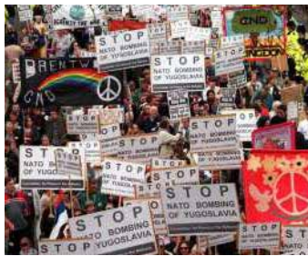
Britische Proteste gegen die Bombardierungen in Jugoslawien.