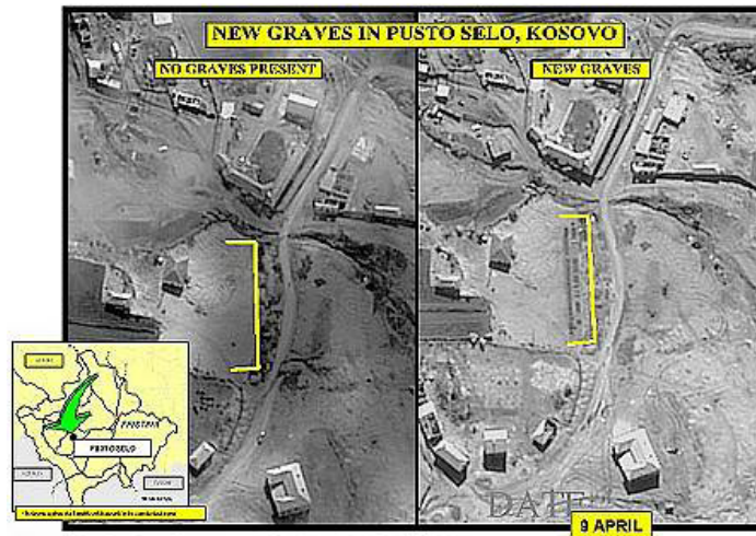
„Neue Gräber in Pusto Selo, Kosovo“, links: „keine Gräber vorhanden“, rechts: „neue Gräber“, aus ‚Tagesspiegel‘, 13.4.1999, Quellenangabe: rtr. Bildunterschrift: „Foto-Vergleich: Auf der linken, älteren Aufnahme ist die markierte Fläche bei dem Ort Pusto Selo glatt, auf dem rechten Foto vom 9. April sind an gleicher Stelle dunkle Flecken zu erkennen, die Gräber sein könnten.“

Ein eindeutiges Urteil! Gewalt im Kosovo – in keinem einzigen Bericht der OSZE findet sich auch nur ein Indiz für eine drohende humanitäre Katastrophe. Was die internationalen Fachleute beobachteten, waren Situationen wie diese: Rebellen der so genannten Kosovo-Befreiungsarmee UCK kämpften gegen reguläre jugoslawische Truppen. Ein Bürgerkrieg – so die OSZE. Vor diesen Kämpfen flohen