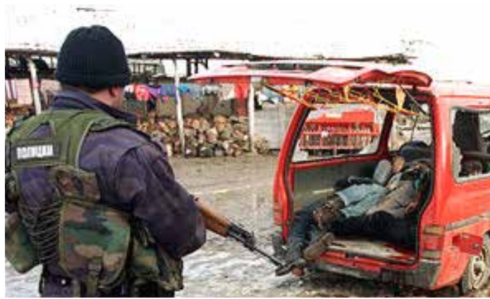
Der zerschossene rote Kleinbus von Rugovo.

FRAGE: „Bei dem Beispiel Rugovo, auf welche Quellen haben Sie sich dabei berufen?“