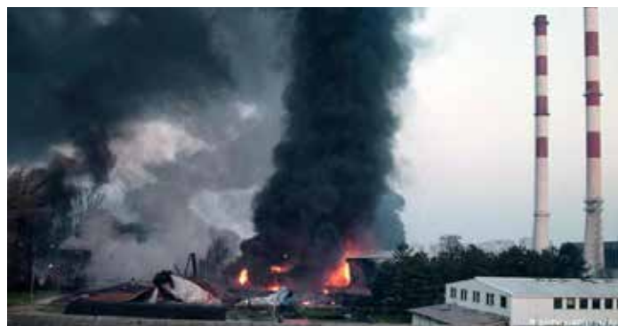
In Pancevo bei Belgrad treffen die Nato-Bomben Chemieanlagen und eine Düngemittelfabrik

JAMIE SHEA, NATO-SPRECHER: „Das Wichtigste ist, dass der Feind nicht das Monopol auf die Bilder haben darf, denn das rückt die Taktik der Nato in das Licht der Öffentlichkeit und nicht die bewusste Brutalität von Milosevic: Etwa, ob wir eine perfekte Organisation sind, oder ob wir einen perfekten Luftkrieg führen