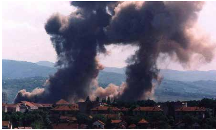
Bomben auf die Autofabrik Zastava (Kragujevac), sie wurde in schud und Asche gelegt, Zivilisten kamen ums Leben.

Zeugen aus Pristina also. Wenn einer aber etwas mitbekommen hat,