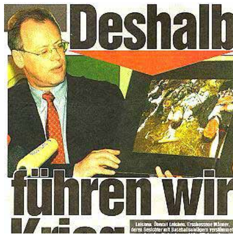
Kriegshetze und Rechtfertigung des Nato-Bombardements

ORIGINALTON IM SERBISCHEN RADIO: „Eine große Gruppe feindlicher Flugzeuge nähert sich Belgrad. Wir bitten alle Bürger ihre Lichter auszumachen. Nachdem Sie die Räume verdunkelt haben, appellieren wir an Sie, den Strom abzuschalten. Achtung, eine große Gruppe feindlicher Flugzeuge in Richtung Belgrad. Bürger,