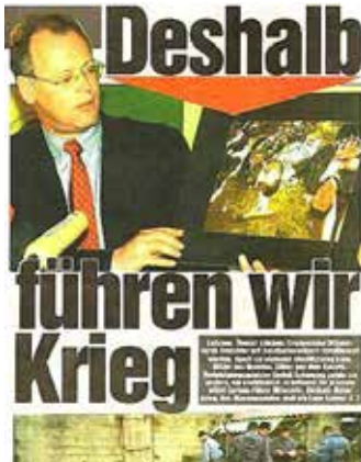
Ausschnitt aus der Titelseite des Express vom 28.4.1999

lich, dass Armeekräfte und Spezialpolizei, später dann auch im Fortgang nicht nur diese, sondern auch regelrechte Banden freigelassener Strafgefangener und anderer, an solchen Mordtaten beteiligt sind. Es sind erschütternde Bilder. Und ich muss mir große Mühe geben, das in einer Tonlage zu schildern, die nicht gewissermaßen zur Explosion führt.“