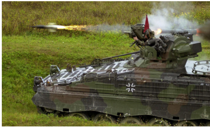
Panzerabwehrlenkwaffe MILAN kurz nach dem Abschuss. Das Startrohr des Lenkflugkörpers wird nach hinten ausgestoßen.

IPPNW und ICBUW fordern Bundesverteidigungsministerin von der Leyen auf, den geplanten Export der Milanraketen rückgängig zu machen. Die Zivilbe-