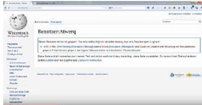
Von Wikipedia gesperrter Benutzer (Screenshot)

Das Beispiel Ganser zeigt es eindrücklich: Aus dem wissenschaftlichen Zweifler wird ein Verschwörungstheoretiker. Eine einfache Kritik wird zum extremistischen Meinungsbild aufgebauscht und die sachliche Auseinandersetzung damit verhindert. Ähnlich funktioniert das auch mit folgenden