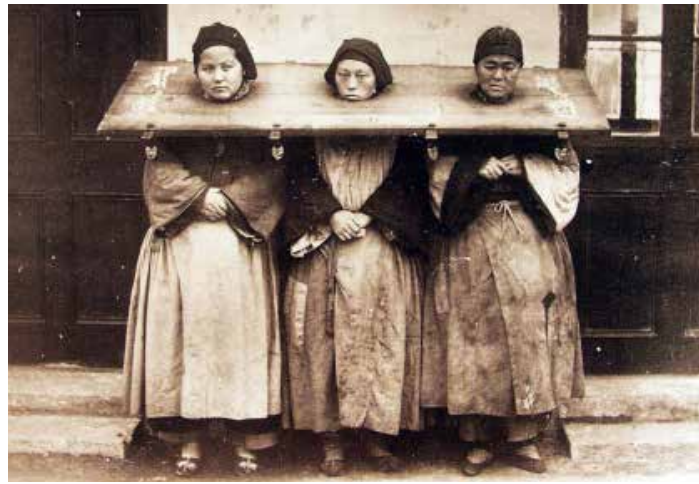
Drei Frauen am Pranger, China, Anonym, um 1875

Doch die stichprobenartige Prüfung fördert auch anderes zutage. So findet man in anderen Porträts ganze Abschnitte, die etwa mit „Kontroverse“, „Rezeption“, „TV-Auftritte“ oder „Politische Aussagen“ betitelt sind. Darin werden Journalisten oder Rezensenten zitiert, die sich über die porträtierte Person äußerten, und das häufig auf eine diffamierende und geradezu niveaulose Weise. Etwa wenn man über Peter Scholl-Latour erfährt, er sei nur ein „selbsternannter Kongokenner und Medienscharlatan“ gewesen, oder der journalistische Blick der Russland-Korrespondentin Gabriele Krone-Schmalz sei von einem „Pflock im Auge“ versperrt. Und Xavier Naidoo, der bei wenigen Gelegenheiten Zweifel an der offiziellen 9/11-Theorie geäußert hat und den Kriegen dieser Welt seine Botschaften von christlicher Nächstenliebe entgegengesetzt möchte - der rührt „Verschwörungstheorien, Demokratiefeindlichkeit, Nationalismus, Antiamerikanismus, Antikapitalismus und Friedensgeraune zu einer dunklen Suppe“. Man fragt sich zu Recht, was solche offenen Diffamierungen in einem Lexikon zu suchen haben. Ist das noch Wikipedia oder schon Klatschpresse? Zumindest wenn es um den suggestiven Anspruch „Bild dir deine Meinung über öffentliche Per-