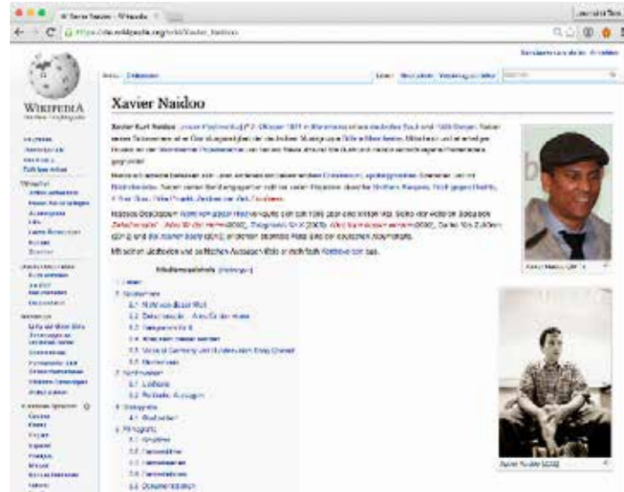
Der Wikipedia-Eintrag von Xavier Naidoo (Screenshot)

Die deutsche Wikipedia ist hierarchisch strukturiert. Es gibt die einfachen Benutzer und die erfahrenen, die Artikel „sichten“ und danach freischalten dürfen, deshalb