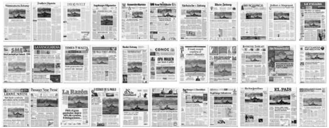
Einen Auswahl von Zeitungen aus der ganzen Welt mit dem selben Inhalt am selben Tag

„Ich habe mich nie für Insider-Kram interessiert. (...) Ich versuchte vielmehr Informationen bereitzustellen, die belegt werden können, so dass die Leser sie selbst überprüfen können. Ich bemühte mich, die Wahrheit aus Anhörungen, offiziellen Mitschriften und Regierungsdokumenten so akkurat wie möglich freizulegen. (...) In jeder Ausgabe habe ich versucht, Fakten und Meinungen, die sonst nirgends in der Presse aufzufinden sind, zu bieten.“