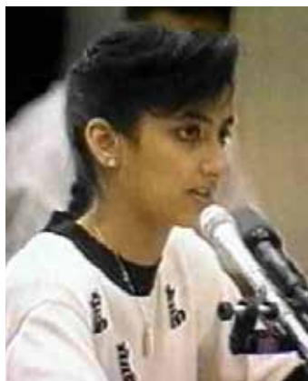
Naria a kongresszus bizottsága előtt.

Nézzük csak meg: A kereszties háborúk igazából sohasem értek véget. Ma csak egy kicsit más csomagolásban jelennek meg, de akkor is megmaradnak portyázásnak, amiben a letámadtak vallását sorjában ördögi fényben tüntetik fel, főleg azért, hogy a bevonulók értékrendszerét felsőbbredűnek tüntessék fel. Ezt már nem az Übermensch címen adjuk el. Most már a fejlődést képviseljük. De mindkét esetben hullákon átgázolva.