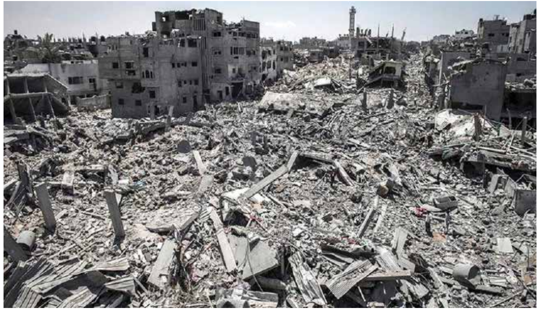
Gáza, 2014. 18 000 lerombolt ház. 100 000 hajléktalan. 3000 halott. 25 000 súlyosan sérült.

Az, hogy Németország egyesítése óta egyre gyakrabban behúnyja mindkét szemét akkor, amikor a német hadsereg katonái a NATO fedőneve alatt globális gyilkosságban vesznek részt, vagy ha a német területen található amerikai katonai támaszpontokat