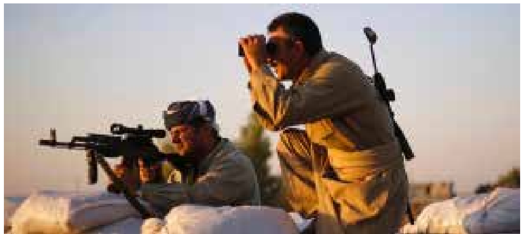
Németország fegyvereket szállít a kurdoknak Irakba.

Nos, a válasz az amerikai cigarettamárka képében található. Az első világháború óta az USA minden lehetőséget megragadott arra, hogy kijátssza egymás ellen Közép-Keletet saját céljai érdeké-