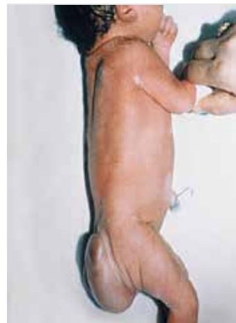
Az invázió óta kétszeresére nőtt a gyermekhalálozások száma. A nyugati csapatok által bevetett urán-lőszer számlájára írhatók a fejlődési rendellenességek is.

Rájött, hogy a NATO rá van utalva Törökországra, hogy sikeresen küzdhessen az IS-harcosok