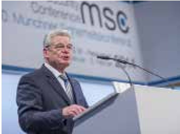
A szövetségi elnök, Joachim Gauck a müncheni Biztonsági Konferencián beszédet tart.

Mintha ez nem is lenne elég, fennáll annak a veszélye, hogy egy nagy kurd háború robban ki a régióban. Egy olyan háború tehát, ami átterjedne Szíriára, Irakra és Iránra és ezzel egész biztosan a