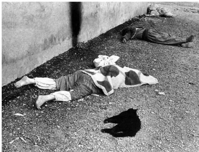
1988-ban Szaddam Husszein 500 kurdot öl meg Irakban mérgező gázzal.

Egy saját üzemszámítógéppel magyarázható meg