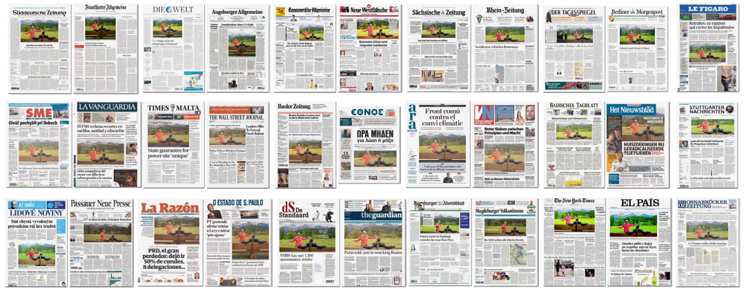
Einen Auswahl von Zeitungen aus der ganzen Welt mit dem selben Inhalt am selben Tag

„Ich habe mich nie für Insider-Kram interessiert. (...) Ich versuchte vielmehr Informationen bereitzustellen, die belegt werden können, so dass die Leser sie selbst überprüfen können. Ich bemühte mich, die Wahrheit aus Anhörungen, offiziellen Mitschriften und Regierungsdokumenten so akkurat wie möglich freizulegen. (...) In jeder Ausgabe habe ich versucht, Fakten und Meinungen, die sonst nirgends in der Presse aufzufinden sind, zu bieten.“