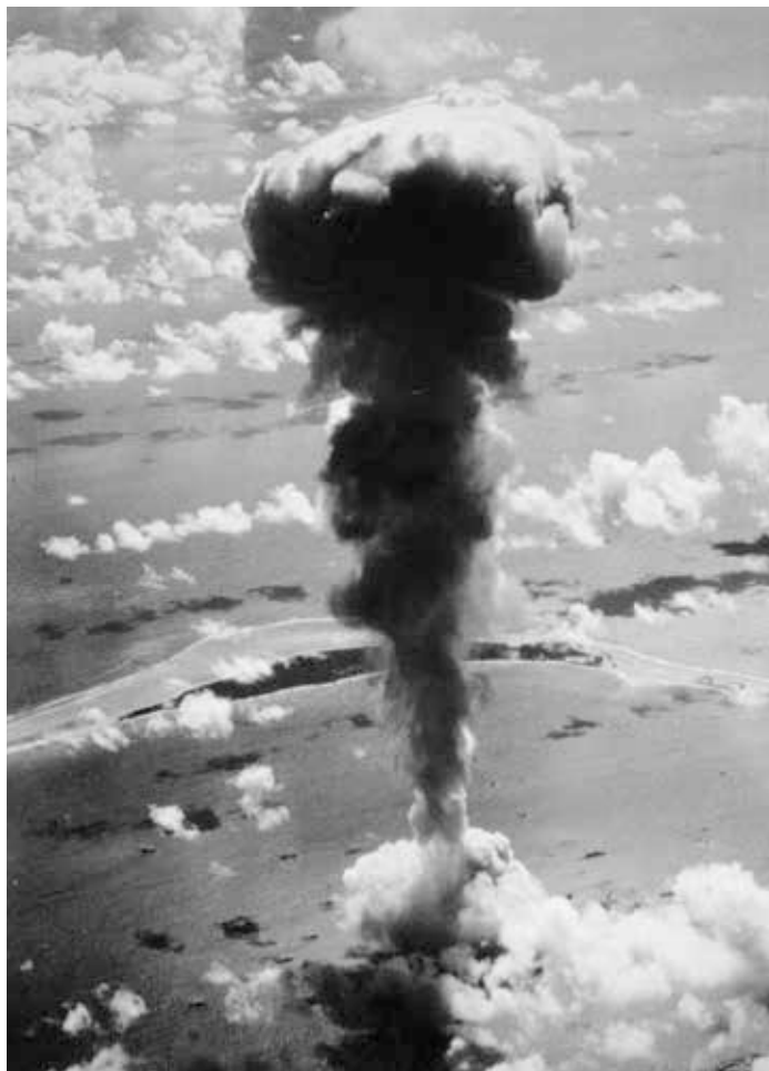
Das Bikini-Atoll, 1. Juli 1946

Ich stand am Strand und sah inmitten des Smaragdgrüns des Pazifik ein riesiges schwarzes Loch: Das war der Krater, den die Wasserstoffbombe mit dem Namen „Castle Bravo“ hinterlassen hat. Ihre Explosion hat die Menschen und die Umgebung über Hunderte von Kilometern vergiftet, wahrscheinlich für immer. Auf meiner Rückreise landete ich auf dem Flughafen von Honolulu. Ich sah ein amerikanisches Magazin namens „Women’s Health“, auf dem Titelbild eine lächelnde