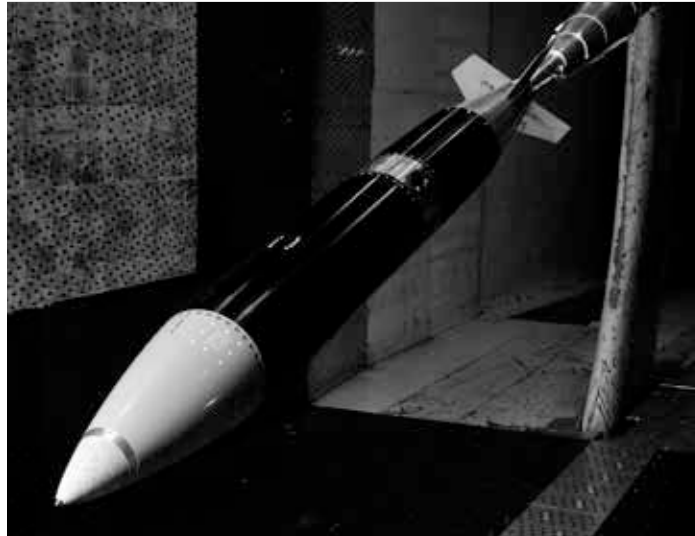
B61-12 Nuclear Bomb Design

Was die Gefahr eines Atomkrieges noch vergrößert, ist die gleichzeitige Kampagne gegen China. Es vergeht kaum ein Tag, an dem China nicht in den Rang einer „Bedrohung“ befördert wird. Laut Admiral Harry Harris, dem US-Pazifik-Kommandanten, „baut China im Südchinesischen Meer eine Große Mauer aus Sand“. Harris bezieht sich mit dieser Aussage auf die chinesischen Bauarbeiten für Landebahnen auf den Spratly-Inseln, welche ein Streitobjekt zwischen China und den Philippinen sind. Ein eher belangloser Zwist, bis Washington die Regierung in Manila bestach und erpresste und das Pentagon eine Propagandakampagne mit dem Namen „freedom of navigation“ startete. Was bedeutet das in Wirklichkeit? Es meint, dass amerikanische Kriegsschiffe die Freiheit besitzen sollen, in