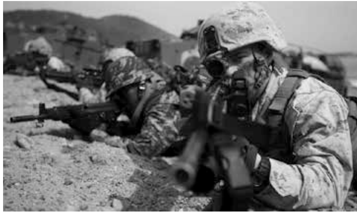
US-Übung, Codename „Talisman Sabre

Zu Clintons größten Unterstützern gehören die Israel-Lobby und die Waffenschmieden, die die Gewalt im Nahen Osten anheizen. Clinton und ihr Mann haben von der Wall Street ein Vermögen erhalten, und doch wurde sie dazu bestimmt, als Kandidatin der Frauen den bösen, superreichen Trump zu besiegen, den offiziellen Dämon. Zu ihren Unterstützerinnen zählen auch pro-