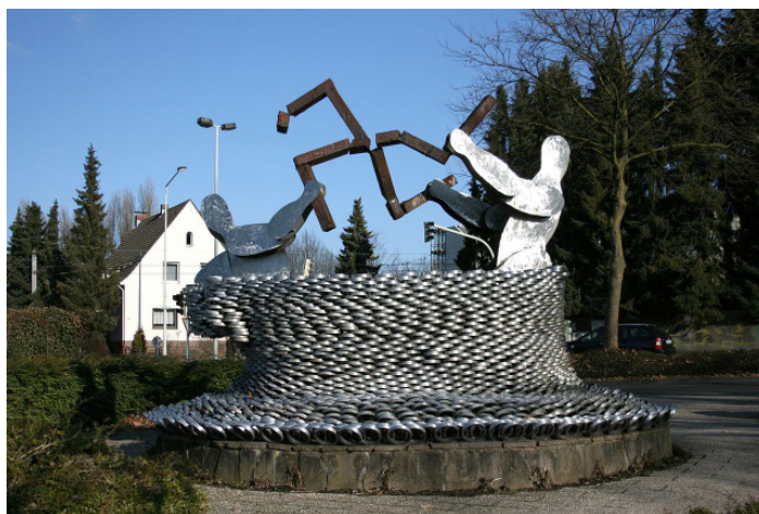
Mahnmal für den Brandanschlag von Solingen: „Verbunden wie diese Ringe wollen wir miteinander leben“

temberg und dem NSU im Untergrund agierte, hätte die bis heute aufrechterhaltene Legende zerstören können, staatliche Behörden hätten dreizehn Jahre nichts gewusst.