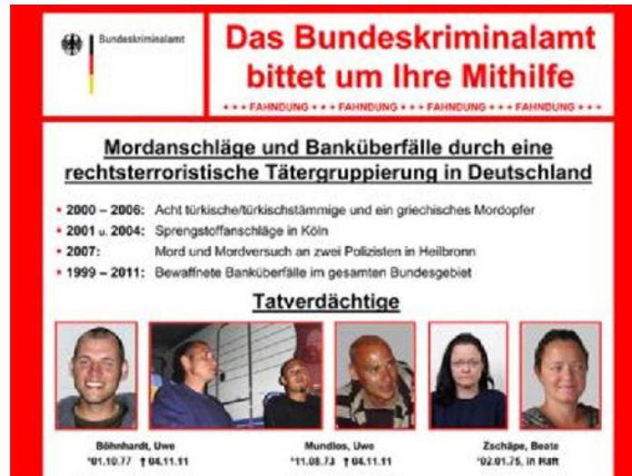
Mit diesem Plakat bat das BKA die Öffentlichkeit um Mithilfe.

„Für das Kapitel im Abschlussbericht über ‚Mögliche Fehler der Ermittlungsbehörden‘ im Fall Kiesewetter soll die FDP zuständig gewesen sein, die ihren Abgeordneten