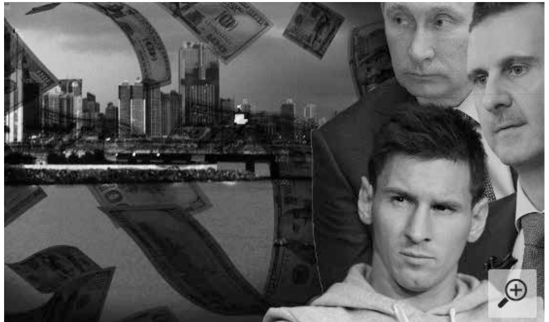
Dieses Bild wurde von T-Online gezeigt als Illustration zum Panama Papers Bericht. Überschrift: „Panama Papers“ belasten diese neun „Top Player“ – die Auswahl an Steuersündern ist aber viel größer und weltweit.

man von den „Panama Papers“ keine Enthüllungen erwarten, die der internationalen Finanzelite gefährlich werden könnten.