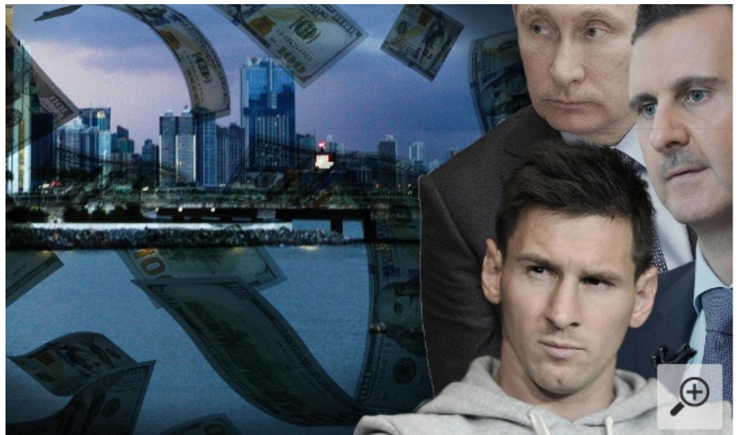
Dieses Bild wurde von T-Online gezeigt als Illustration zum Panama Papers Bericht. Überschrift: „Panama Papers“ belasten diese neun „Top Player“ – die Auswahl an Steuersündern ist aber viel größer und weltweit.

man von den „Panama Papers“ keine Enthüllungen erwarten, die der internationalen Finanzelite gefährlich werden könnten.