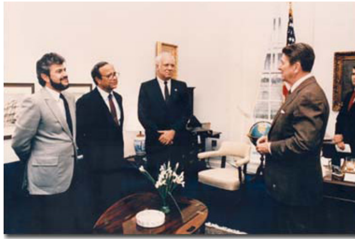
US-Präsident Ronald Reagan trifft sich mit den Mitgliedern der Nicaraguanischen Contra Bewegung. Oliver North steht ganz rechts.

Ähnlich verhält es sich auch in jenen Kriegen der USA, die nach dem Fall des Eisernen Vorhanges begonnen haben. Exemplarisch hierfür ist ein weiteres Mal Afghanistan. Seit die NATO-Truppen dort unter der Führung Washingtons stationiert sind, floriert der Opiumanbau und bricht jedes Jahr Rekorde. Kurz vor dem Einmarsch der NATO stammten rund fünf bis zehn Prozent des weltweiten Schlafmohns aus dem Land – mittlerweile sind es mehr als neunzig Prozent.