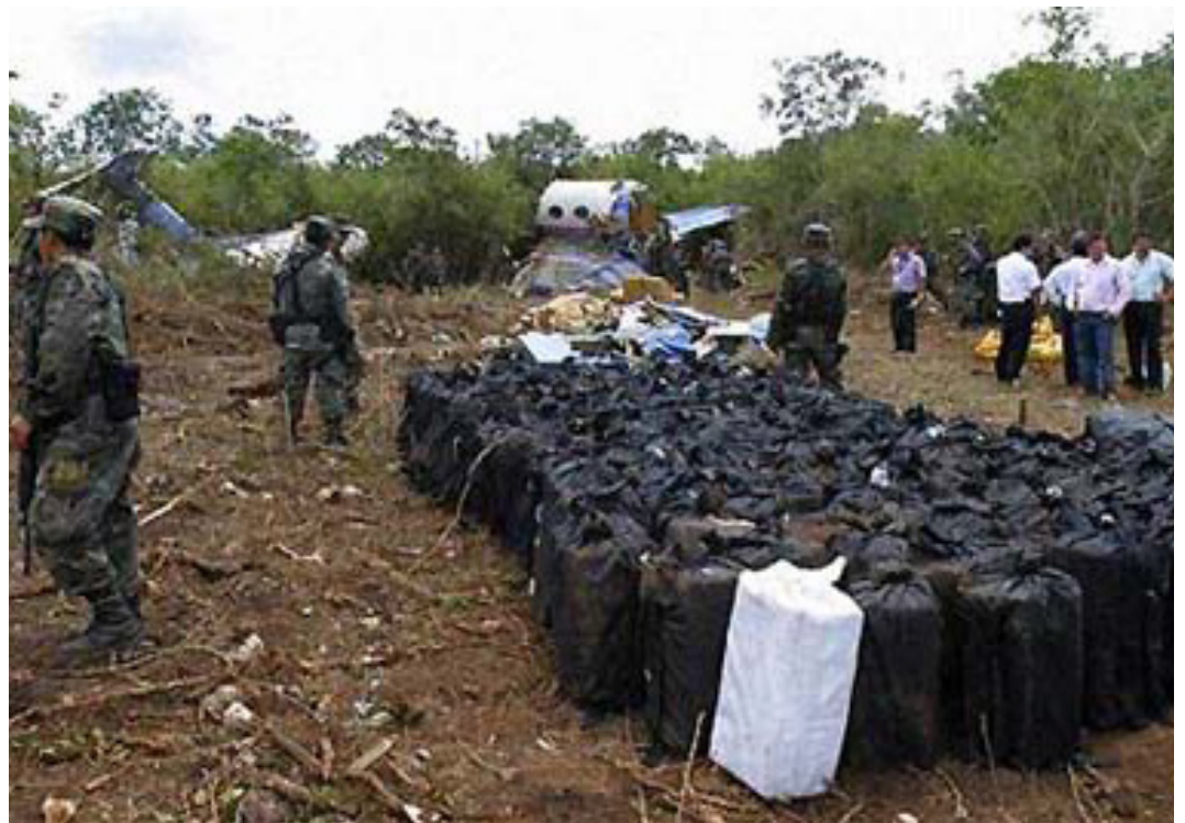
Yucatan, 2007: Ein Flugzeug der CIA, das früher für das „extraordinary rendition“ Programm genutzt wurde, stürzte in 2007 auf Yucatan mit 3,2 Tonnen Kokain an Bord ab.

Der Grund hierfür ist die Tatsache, dass nahezu jede Intervention Washingtons, ob geheim oder offiziell, mit dem globalen Drogenhandel Hand in Hand ging. Ähnlich wie der sogenannte Krieg gegen den Terror, der in den letzten Jahren vor allem den Terror