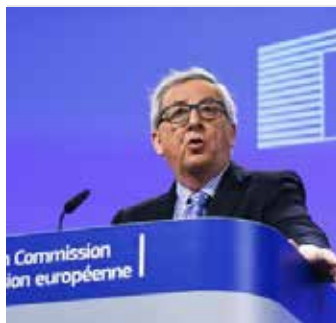
Die EU sagt ja

Dann aber geschah Unerwartetes: Kaum hatten Merkel und