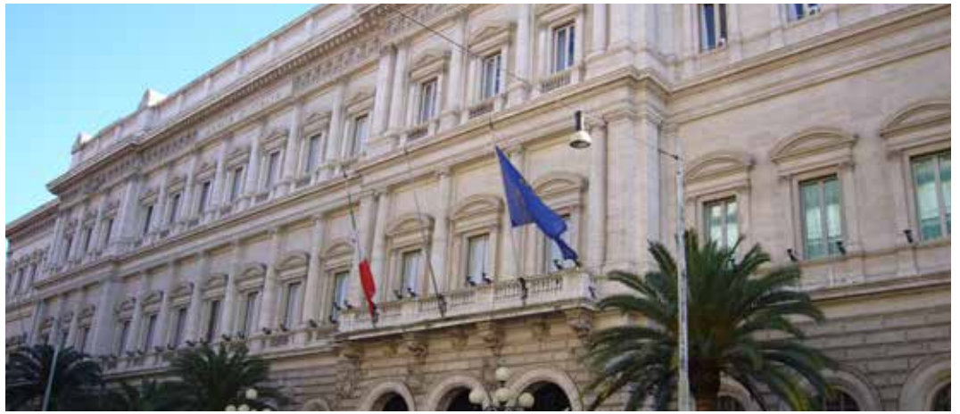
Italienische Zentralbank

Die deutsche Bundeskanzlerin Merkel und ihr Finanzminister Schäuble reagierten umgehend mit einer scharfen Ablehnung und forderten Renzi auf, erneut die geltende Bail-in-Regelung anzuwenden. Ihr kategorisches Nein überraschte nicht, denn Deutschland muss als