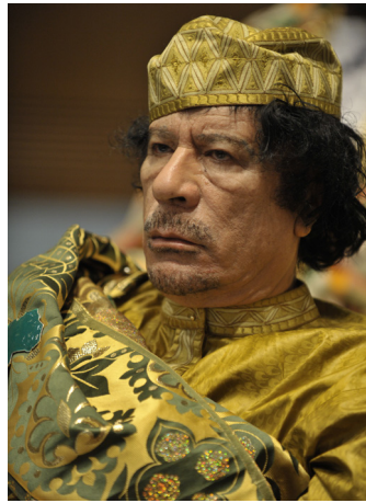
Muammar al-Gaddafi – „kein Beweis oder Motiv für die Behauptung, er habe Massenmorde geplant“

Zwei Tage bevor die NATO Libyen bombardierte, brach ein weiterer bewaffneter islamistischer Aufstand aus in Daraa, Syriens