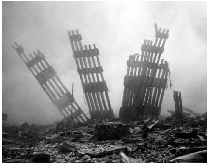
Die Zerstörung von den zwei Zwillingstürmen am 11. September 2001 war nahezu absolut.

Wer ehrlich genug ist, einzuräumen, dass die Bewertung der Hintergründe eines historischen Ereignisses keine ewige Wahrheit beanspruchen kann, sondern, so wie alle Bewertungen, ob nun in Politik oder Wissenschaft, auf Fakten fußt, deren Kenntnis, Verbreitung und Einschätzung sich mit der Zeit ändert, der wird auch zugestehen, dass nicht alle Zweifler zu Verrückten erklärt werden können. Ehrlicher wäre es, die Zweifel im Einzelnen zu untersuchen und ihre jeweilige Schlüssigkeit oder auch Unschlüssigkeit differenziert zu diskutieren. Da-