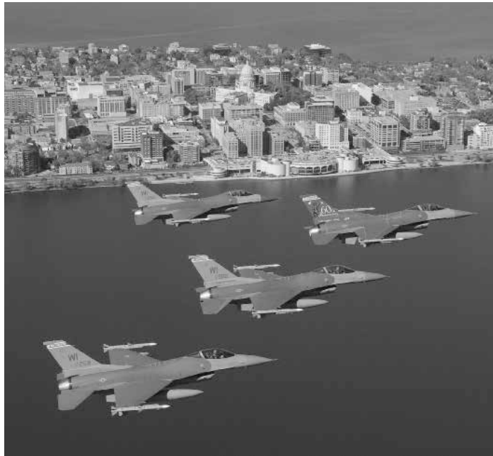
Während der Anschläge fand zeitgleich ein Militärmanöver statt, bei dem eine Flugzeugführung „geprobt“ werden sollte (Foto: Wisconsin ANG, F-16 Fighting Falcons über Wisconsin)

Es ist auch zu erwägen, dass die für eine Sprengung nötige komplexe Verkabelung der Gebäude unter dem Schutz einer plausiblen Tarngeschichte vonstatten