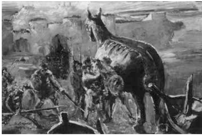
Das Trojanische Pferd (Ausschnitt) von Ludwig Corinth

Das Cover zielt ein Gerhard Schröder mit schwarzem Balken über den Augen. Der Geist McCarthys weht wieder mächtig. Nur dass es diesmal nicht US-amerikanische Politiker, Intellektuelle und Kulturschaffende sind, die wegen russlandfreundlicher Umtriebe neutralisiert werden müs-