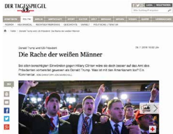
Artikel in dem Tagesspiegel: Die Rache der weißen Männer

Viele hielten es für einen Scherz, als Trump im vorigen Jahr seine Kandidatur ankündigte: Soll er doch, solange es ihm Spaß macht – und uns. Fast eineinhalb Jahre ist das her, heute lacht niemand mehr. Jetzt steht ein sexuell übergriffiger Rassist, pathologischer Lügner und nervöser Egomane an der Spitze der Vereinigten Staaten: Indiskutabel für alle, die an Demokratie und Menschenrechte oder wenigstens an den gesunden Verstand der Menschen im Allgemeinen, der Amerikaner im Besonderen glauben. Verdammt, sie hatten nur einen Job: diesen Mann zu verhindern!