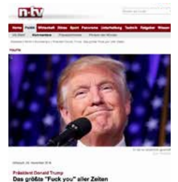
Artikel in n-tv Das größte „Fuck you“, aller Zeiten

Trump hat das Gefühl von Leuten getroffen, die glauben, sie seien zu kurz gekommen. Der linke Filmemacher Michael Moore, der erst Bernie Sanders, dann Clinton unterstützte, hat es auf den Punkt gebracht: Für seine Wähler sei Trump „ein menschlicher Molotow-Cocktail“, sein Sieg werde „das größte ‚Fuck you‘ aller Zeiten“ sein, „und es wird sich gut anfühlen“ – jedenfalls für den Moment.“ Quelle: n-tv