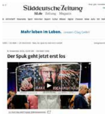
Artikel in Süddeutsche Zeitung: Der Spuk geht jetzt erst los

Niemand weiß, was sein Credo „America first“ für die künftige US-Außenpolitik zu bedeuten hat. Seine Vorstellungen über den Umgang mit Russland, mit dem Iran, mit dem Syrienkonflikt und dem Nahen Osten insgesamt legen den Verdacht nahe, dass Donald Trump sein Land in Richtung eines wirtschaftlichen und politischen Nationalismus führen möchte. Das sieht in der Tat alles