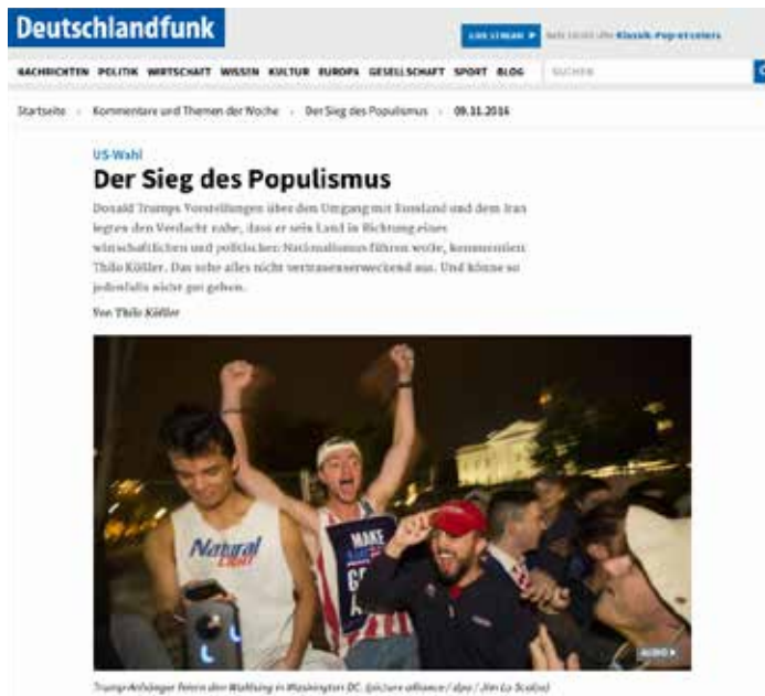
Artikel in Deutschlandfunk von 9.11.2016: Der Sieg des Populismus