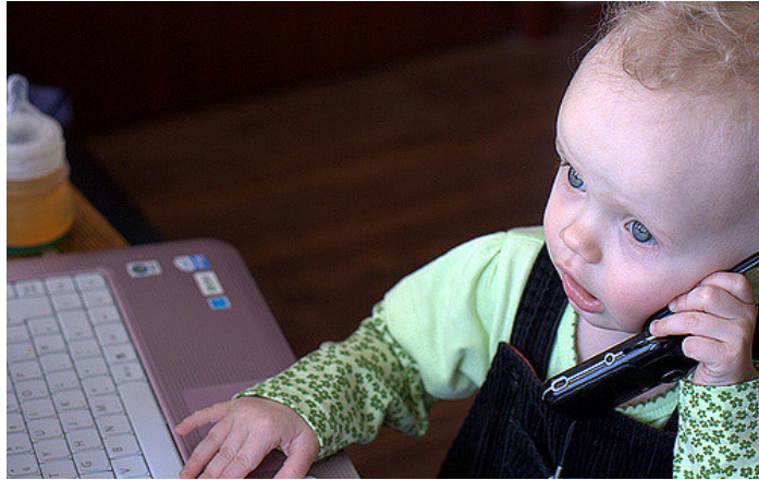
Business baby must-haves

FRANZ ADLKOFFER: Das Vorgehen des Strahlungskartells, von dem es heißt, es sei zu groß, um unterzugehen, beruht nicht auf Witz und Verstand, sondern einerseits auf wirtschaftlicher und politischer Macht und andererseits auf der charakterlichen Schwäche allzu vieler Vertreter aus Politik und Wissenschaft, die sich gegen Einwurf kleiner Münzen willig missbrauchen lassen.