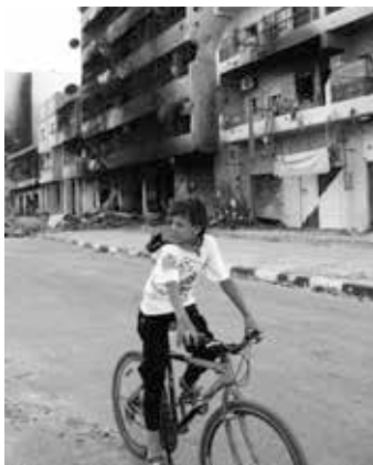
Misrata, Libyen 2011.

in naher Zukunft auch bewaffnete Drohnen in Libyen zum Einsatz kommen. Der Drohnen-Standort Tunesien ist hierbei lediglich als eine weitere strategische Erweiterung des Pentagons auf dem afrikanischen Kontinent zu betrachten. Weitere Drohnen-Basen lassen