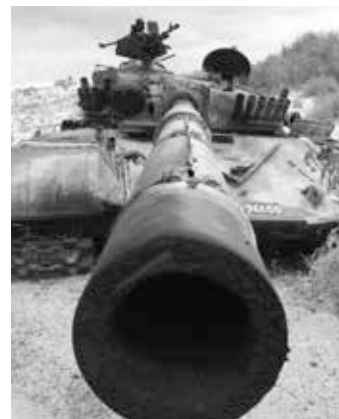
Zerstörter Panzer in Libyen.

Obama macht selbst in den letzten Monaten seiner Amtszeit deut-