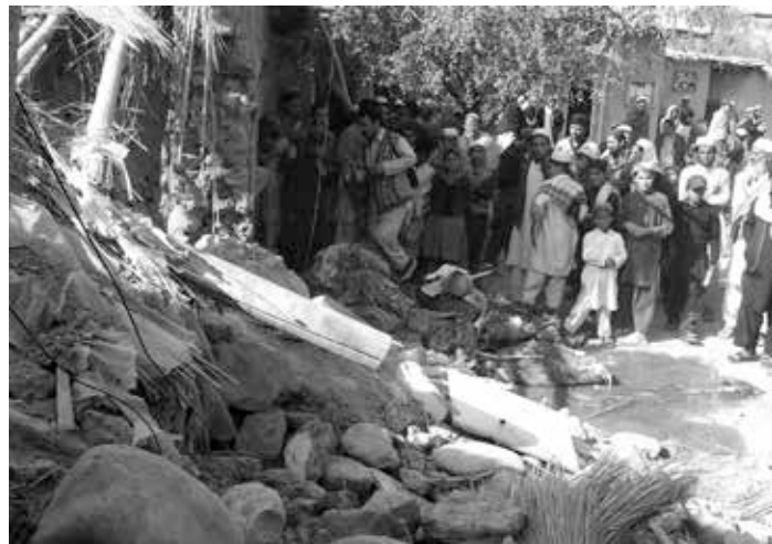
Ein mutmasslicher Terrorist und mehrere andere sind bei dieser Gelegenheit in 2014 ums Leben gekommen.

sich im Niger und in Dschibuti finden. Eine Basis in Äthiopien wurde Anfang 2016 geschlossen. (BBC)