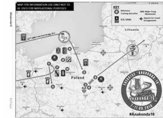
Übungsraum von Anakonda 2016

DANIELE GANSER: Wissenschaftler und Journalisten verarbeiten und transportieren Information. Diese formt immer Weltbilder, denken