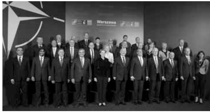
NATO-Verteidigungsminister in Warschau, 2016