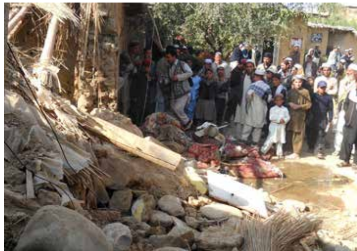
Ein mutmasslicher Terrorist und mehrere andere sind bei dieser Gelegenheit in 2014 ums Leben gekommen.

sich im Niger und in Dschibuti finden. Eine Basis in Äthiopien wurde Anfang 2016 geschlossen. (BBC)