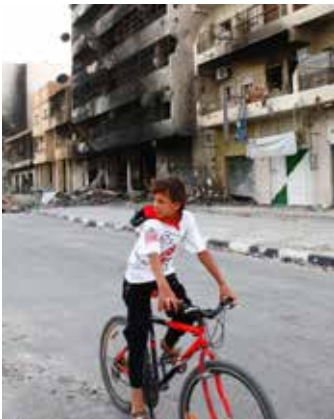
Misrata, Libyen 2011.

in naher Zukunft auch bewaffnete Drohnen in Libyen zum Einsatz kommen. Der Drohnen-Standort Tunesien ist hierbei lediglich als eine weitere strategische Erweiterung des Pentagons auf dem afrikanischen Kontinent zu betrachten. Weitere Drohnen-Basen lassen