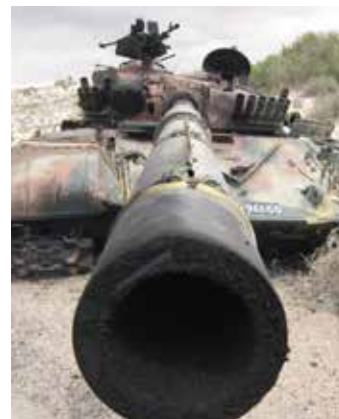
Zerstörer Panzer in Libyen.

Obama macht selbst in den letzten Monaten seiner Amtszeit deut-