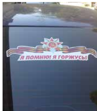
Symbol des Georgsbandes „Ich erinnere! Ich trauere!“

Das Georgs-Band, das Symbol des russischen Sieges über den