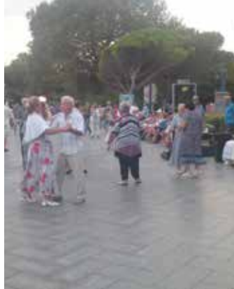
Urlaubsidylle auf der Uferpromenade von Jalta. Von bedrückter Stimmung ist nichts zu spüren.

man tanzt auf dem Boulevard nach traditionellen russischen Weisen. Von bedrückter Stimmung ist hier nichts zu spüren.