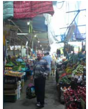
Auf dem Markt von Jalta. Regionalwirtschaft als Hauptversorger

Das einstige sowjetische Kaufhaus ist nur noch eine leer stehende Ruine.