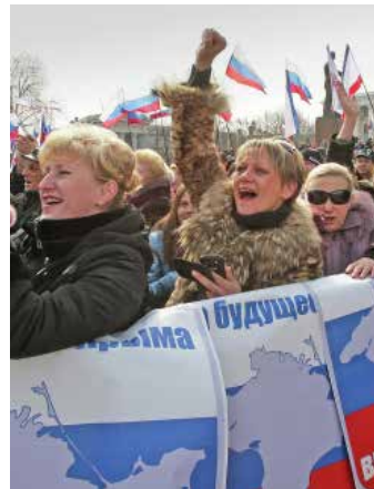
Zurück in der Heimat. Krim-Bewohner feiern die Anerkennung ihres Referendums durch Russland.

Warum sollte die Kiewer Regierung, die bis heute alles tut, um die abtrünnige Ostukraine mit militärischen Mitteln unter ihre Macht zu zwingen, nicht versucht haben, die Krim-Bevölkerung an jenem Referendum zu hindern, zu dem sie aufgrund ihres Autonomie-Status jedes Recht hatten?