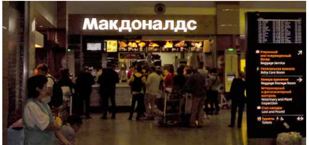
Westliche Sanktionen? McDonalds ist das Erste, was man am Petersburger Flughafen sieht.

St. Petersburg empfängt uns mit strömendem Regen und so zieht es uns schon am ersten Abend in eine