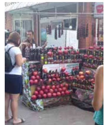
Krim-Tataren Marktführer im Verkauf von Souveniren und Granatapfelsaft

Zwei junge Kioskverkäuferinnen erzählen uns ihre Geschichte: Sie sind als Kinder oder Enkel verschleppter Krim-Tataren in Usbe-