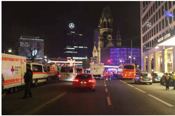
Nach dem Anschlag in Berlin.

Ungeklärt bleibt, warum die Fahndung nach dem Mann erst am Mittwoch begann, also mehr als 24 Stunden nach dem Anschlag. Bekanntlich hatte man zunächst einen anderen Verdächtigen festgenommen, der sich aber als unschuldig erwies. Die Brieftasche tauchte offenbar genau in dem Moment am