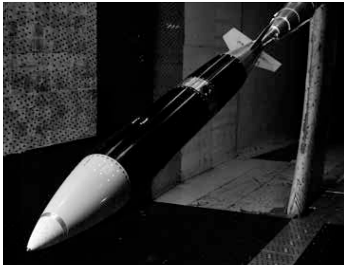
B61-12 Nuclear Bomb Design

Alle sagde: "Havde journalisterne og tv-kanalerne gjort deres job og betvivlet propogandaen mod Saddam Husseins masseødelæggelsesvåben og havde man hverken forstærket eller plagieret George W. Bush og Tony Blairs