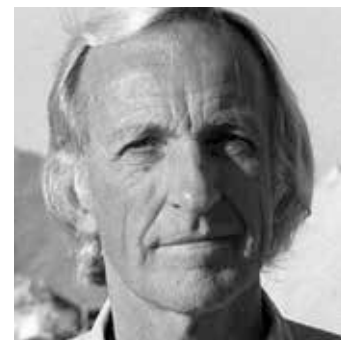
Journalist John Pilger

Hvor mange mennesker er bevidste om, at en Verdenskrig er startet? Lige nu er en propagandakrig med løgne og afledningsmanøvre i gang, men det kan hurtigt ændre sig med en forkert