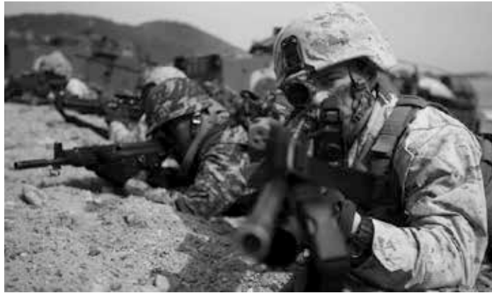
US-øvelsen med kodenavnet „Talisman Sabre

I sidste uge (marts 2016) havde Jeremy Corbyns nærmeste forbundne, hans kandidat til Fi-