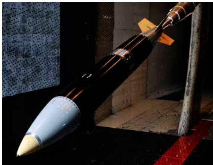
B61-12 Nuclear Bomb Design