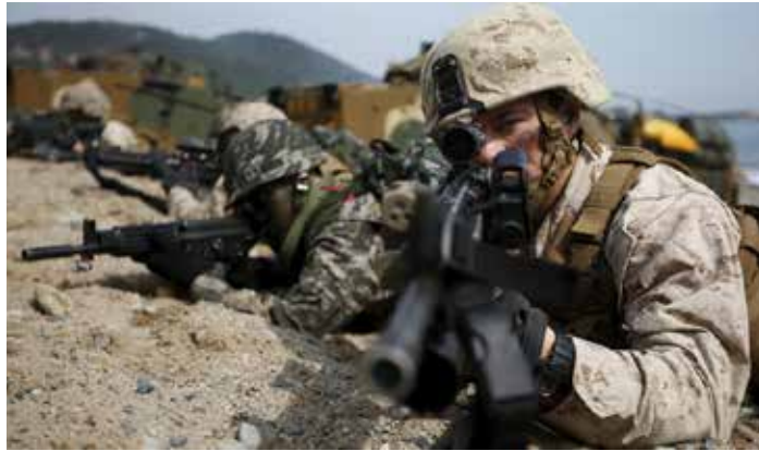
US-øvelsen med kodenavnet „Talisman Sabre

I sidste uge (marts 2016) havde Jeremy Corbyns nærmeste forbundne, hans kandidat til Fi-