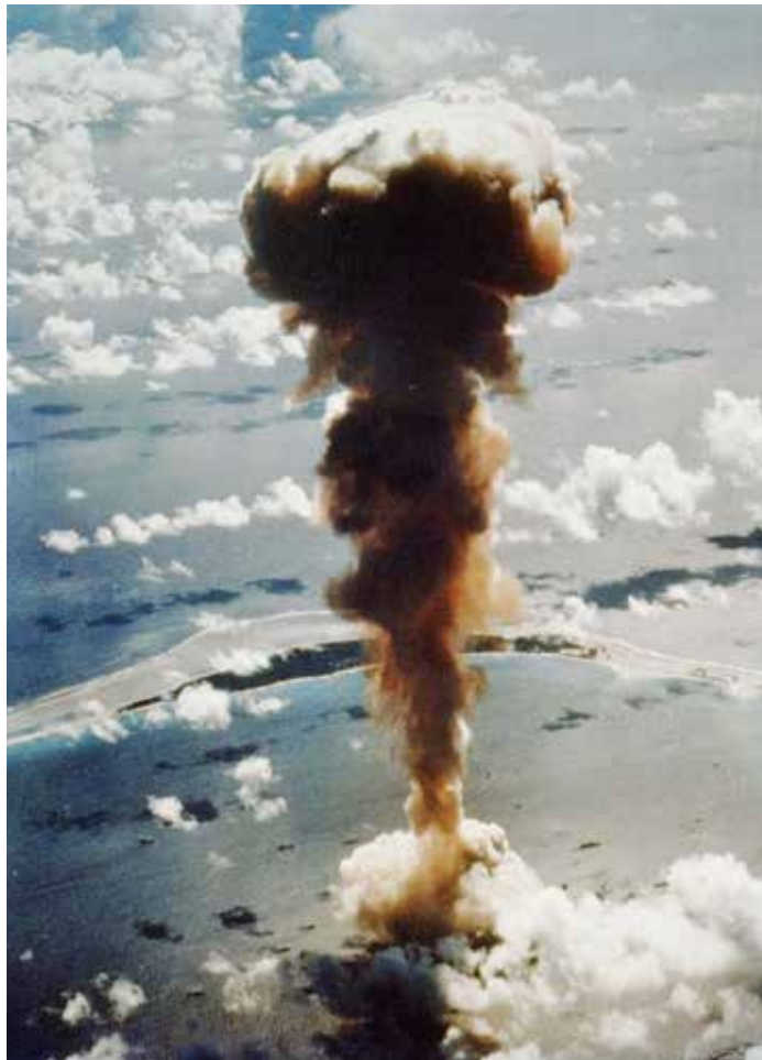
Bikini-Atollen, 1. Juli 1946

På min rejse tilbage mellem-landede jeg i Honolulu lufthavn. Jeg så et amerikansk magasin med navnet "Kvindes Sundhed". På forsiden så man en smilende dame i en bikini, og nedenunder stod der: "Også De kan få en bikinikrop." Et par dage tidligere talte jeg med kvinder på Marshall-øen, de havde helt anderledes "bikinifigurer".