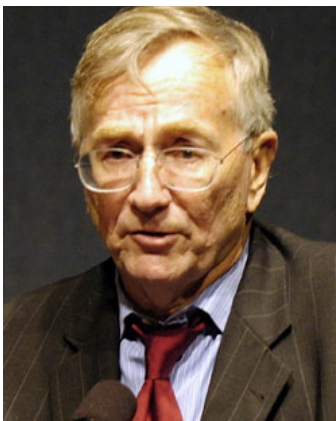
Seymour Hersh