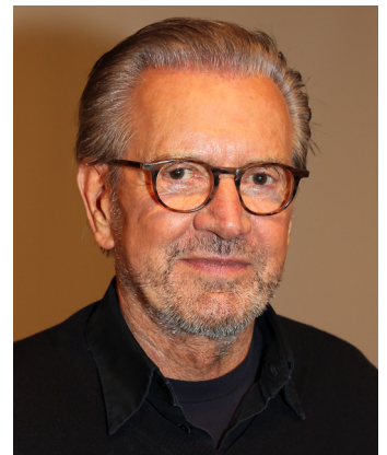
Jürgen Todenhöfer

„Die deutsche Bundesregierung“, schreibt Jürgen Todenhöfer, „sitzt wie der gesamte westliche Mainstream in der ‚Fankurve‘ der USA und betreibt ‚Fankurven-Politik‘: Danach sind amerikanische Bomben gute Bomben, russische Bomben böse Bomben. Moralische Objektivität darf man von Fans nicht erwarten... Al-Quaida und der IS haben in den letzten 20 Jahren mit ihren Terroranschlägen im Westen rund 5000 Menschen ermordet. Inklusive der Anschläge vom 11. September 2011. Wir haben uns zu Recht über diese Anschläge entsetzt... Aber der Westen hat laut Organisation ‚Ärzte gegen den Atomkrieg‘ seit 2001 allein im Irak, in Afghanistan und in Pakistan den Tod von 1,3 Milli-