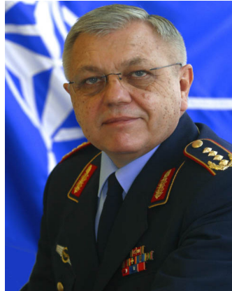
Harald Kujat

- Der Bundeswehrgeneral und ehemalige Vorsitzender des Nato-Militärausschusses Harald Kujat, konstatierte oft und zu Recht, dass durch den Kriegseintritt Russlands die Genfer Syrienkonferenz überhaupt erst möglich geworden ist. Russland und Iran haben sich darüber hinaus auch große Mühe gegeben, um den Syrienkrieg diplomatisch und auf dem Verhandlungswege zu beenden. Sie haben Vorschläge für mehrtägige Waffenruhen in Aleppo immer wieder akzeptiert, während die Rebellen die Waffenruhe für ihre weitere Aufrüstung missbrauchten. Aber die westlichen Verbündeten, Saudi Arabien, die Golfstaaten, Israel und vor allem die bewaffneten Rebellen waren es, die jegliche Verhandlungen mit Assad ablehnten und seinen Sturz zur Vorbedingung für Verhandlungen machten. Dem Westen und den USA fehlte offensichtlich der Wille, ihre Krieg und Unruhe stiftenden Verbündeten zu einer Verhandlung mit Assad zu zwingen. Dabei müsste es jedem Politiker mit Weitsicht und Verstand sonnenklar gewesen sein, dass Assad überhaupt nicht zurücktreten kann, selbst wenn er wollte. Man hat es im Westen nie verstanden oder verstehen wollen: Assad repräsentiert sämtliche re-