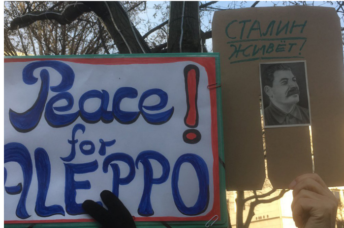
Demonstration vor der Russischen Botschaft in Berlin am 7. Dezember 2016.

Es befremdet uns außerordentlich, dass die West-Medien, auch die UnterzeichnerInnen des anti-russischen Aufrufs, mit keinem Wort die fatale US-amerikanische Politik des Regime Change im Nahen und Mittleren Osten erwähnen, geschweige denn kritisieren. Sind doch das offenkundige Ergebnis dieser Politik lauter „failed states“, sog. gescheiterte Staaten, die den Nährboden für die weitere Ausbreitung des Terrorismus und den Hauptgrund für die anhaltenden Flüchtlingsströme bilden. Wie blind-fragen wir muss man eigentlich sein, um eine schwer zu leugnende Realität zu übersehen? Dem Syrien-Experten Prof. Günter Meyer wie auch Michael Lüders zufolge, dem kennt-