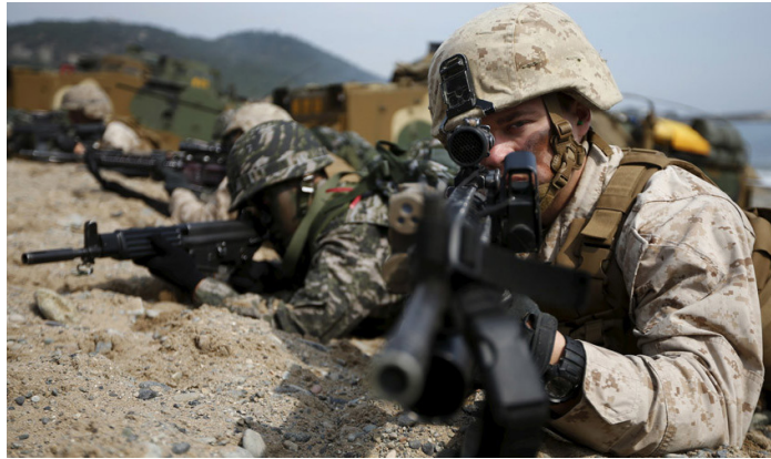
US-øvelsen med kodenavnet „Talisman Sabre

I sidste uge (marts 2016) havde Jeremy Corbyns nærmeste forbundne, hans kandidat til Fi-