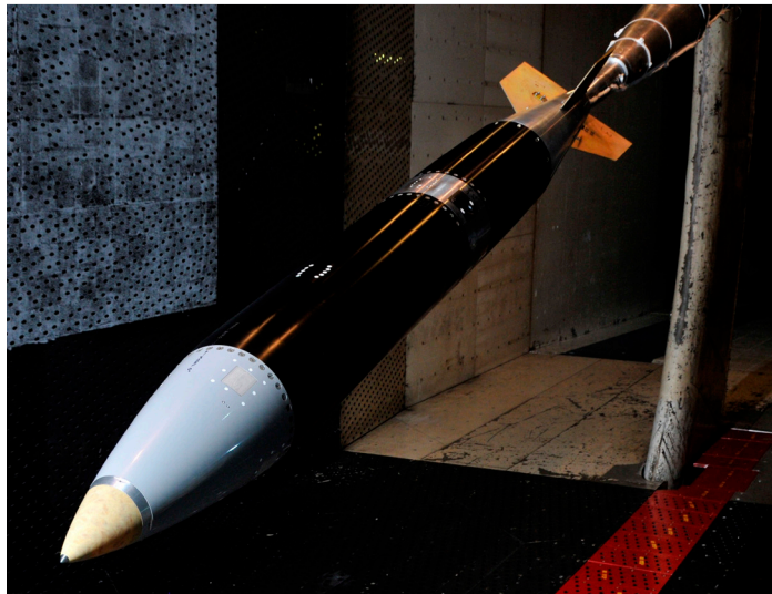
B61-12 Nuclear Bomb Design

Alle sagde: "Havde journalisterne og tv-kanalerne gjort deres job og betvivlet propogandaen mod Saddam Husseins masseødelæggelsesvåben og havde man hverken forstærket eller plagieret George W. Bush og Tony Blairs