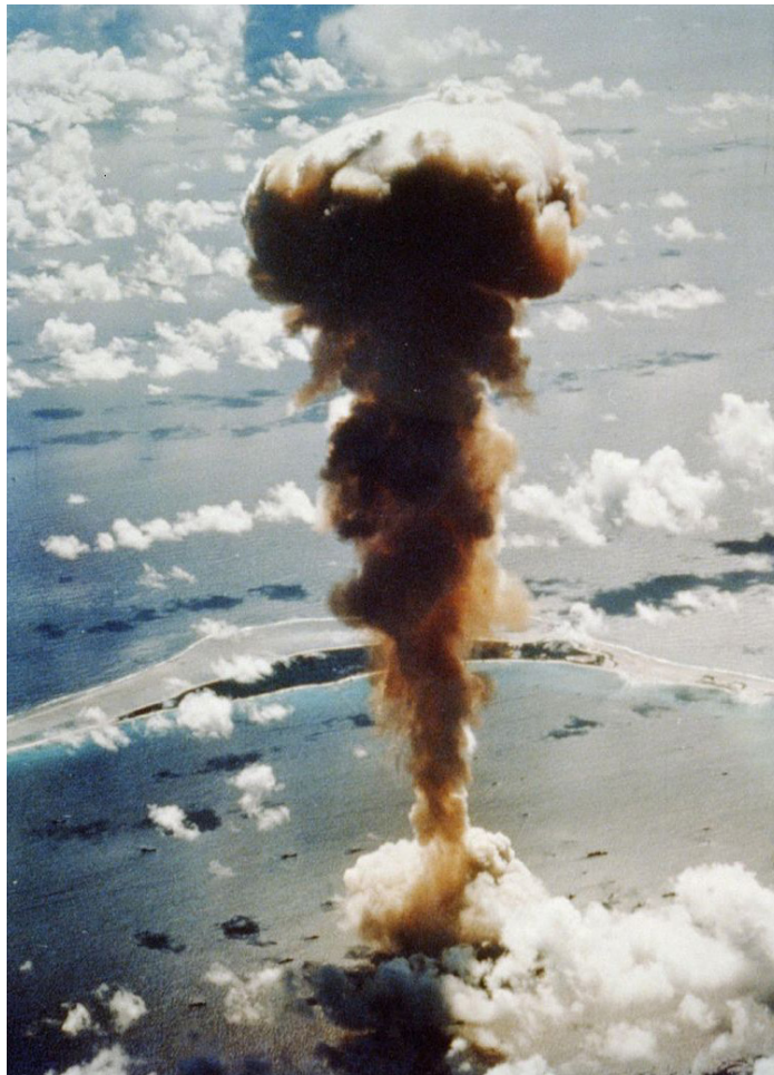
Bikini-Atollen, 1. Juli 1946

På min rejse tilbage mellem-landede jeg i Honolulu lufthavn. Jeg så et amerikansk magasin med navnet "Kvindes Sundhed". På forsiden så man en smilende dame i en bikini, og nedenunder stod der: "Også De kan få en bikinikrop." Et par dage tidligere talte jeg med kvinder på Marshall-øen, de havde helt anderledes "bikinifigurer".