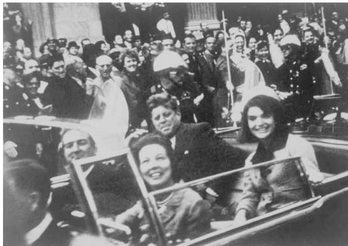
Kennedy und seine Frau Jacqueline mit dem Texas Guvernör John Connally Minuten vor dem Anschlag