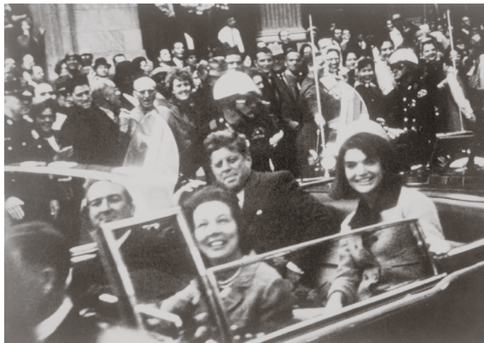
Kennedy und seine Frau Jacqueline mit dem Texas Gouvernör John Connally Minuten vor dem Anschlag

MATHIAS BRÖCKERS: Aufgeklärt ist es eben nicht, schon die zweite offizielle Untersuchung durch das „House Select Committee of Assassinations“ (HSCA) in den 1970er Jahren stellte fest, dass der „Warren Report“ von 1964, der in 26 Bänden die Einzeltäterschaft von Lee Harvey Oswald beweisen wollte, nicht der Wahrheit entsprechen kann. Seitdem haben zahlreiche Forscher viele weite-