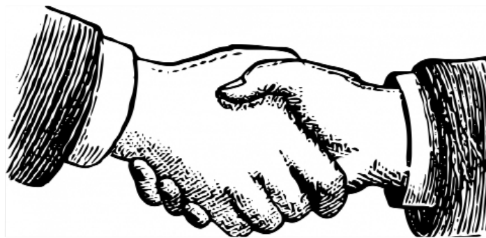
Handschlag zwischen Merkel und Trump im Weißen Haus

Dennoch galt es natürlich, einen guten Eindruck zu machen und so hatte sie ihre wichtigsten