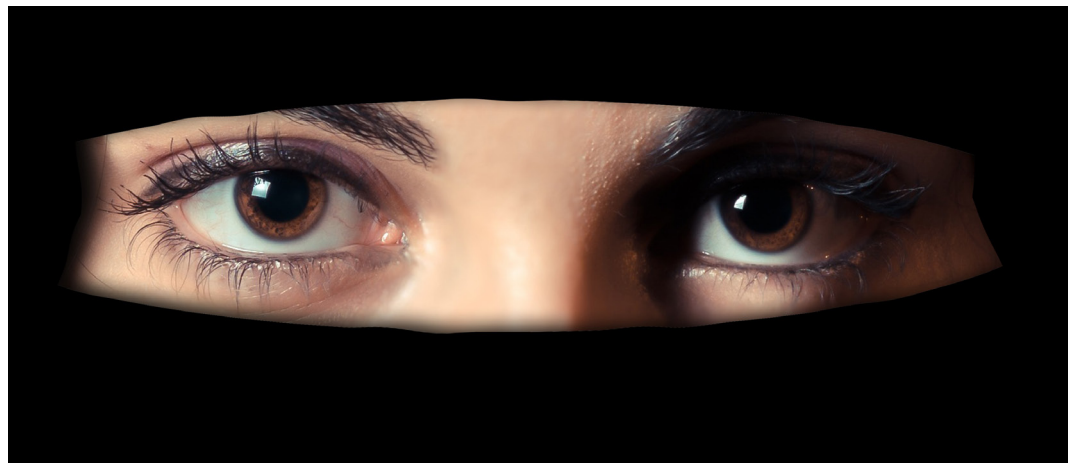
Fotomodel mit Niqab

Zu den wichtigsten demagogischen Tricks gehört das selekti-