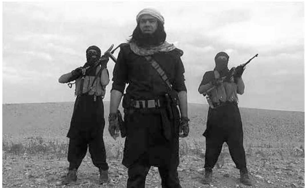
ISIS Kämpfer

Medienberichte nach der Eroberung großer Teile des nördlichen und zentralen Irak durch ISIS in diesem Sommer (2014) kennzeich-