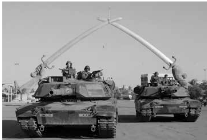
Zwei M1A1 Abrams-Kampfpanzer vor dem Triumphbogen „Schwerter von Kadesia“ im November 2003

Eine offizielle Stellungnahme seitens des irakischen Ölministeriums im August (2014) warnte davor, dass sämtliches nicht von Bagdad lizenziertes Öl illegal vom IS geschmuggeltes Rohöl enthalten könne: „Internationale Abnehmer [von Rohöl] und