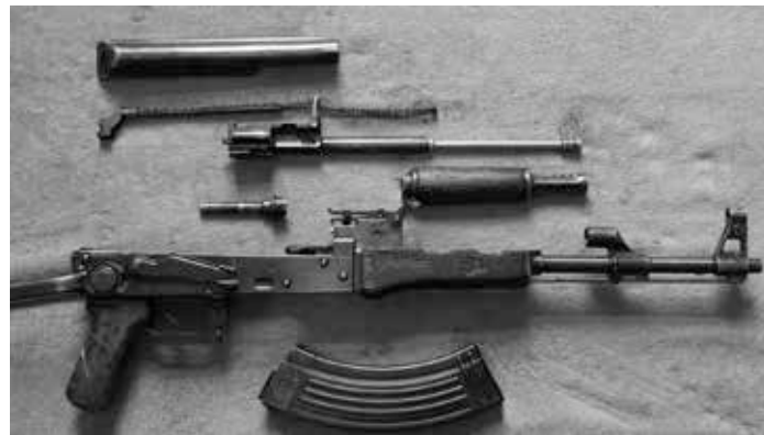
Sturmgewehr AK-47 (Lizenz: CCo)

Islamischen Staats von Irak und Syrien und der Nusra-Front, welche beide Abspaltungen von Al Kaida darstellen, vergrößert haben“. Mit Al Kaida verbundene Rebellen hatten „die Kontrolle der über den Norden und Osten des Landes verstreuten Öl- und Gasfelder übernommen“, während eher gemäßigte „vom Westen unterstützte Rebellengruppen nicht in den Ölhandel verwickelt