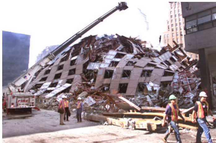
Das Gebäude 7 nach dem Einsturz

Wer verteidigt ihn? Seine Kollegen nicht. Sie wollen ihn so schnell wie möglich los werden. Die Wahrheit ist eine Bedrohung für ihre Karriere. Sie können sich nicht erlauben, mit der Wahrheit in Verbindung gebracht zu werden. Dieses Wort ist in Amerika ein Karrierekiller.