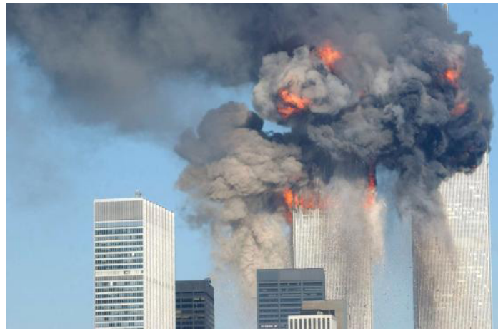
11. September 2001

Später an diesem Tag erklärte Larry Silverstein, dem das World Trade Center gehörte, bzw. der es vermietete, im Fernsehen, dass der Zusammenbruch im freien Fall des dritten WTC Wolkenkratzers, Gebäude 7, eine bewusste Entscheidung war, um das Gebäude abzureißen (Im Original: ...to “pull” the building. [Anm.d.R.]) Diese Redewendung wird benutzt, um einen geplanten Abriss zu beschreiben bei dem ein Gebäude mit Sprengstoff versehen wird, um es abzureißen. Gebäude 7 wurde nicht von einem Flugzeug getroffen und hatte nur geringfügigen Schaden und nur wenig Brände. Die Aussage Silversteins wurde nachträglich dahingehend von den Behörden korrigiert, dass die Feuerwehrleute aus dem Gebäude abgezogen wurden.