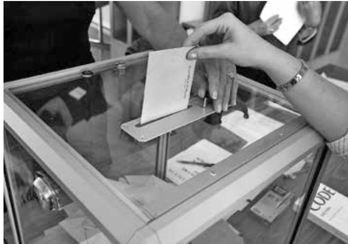
Stimmabgabe beim zweiten Wahlgang der Präsidentschaftswahl in Frankreich 2007

Der wesentliche Schritt zu dieser Bedeutungsverschiebung wurde mit der Erfindung des Modells einer „repräsentativen Demokratie“ geleistet. Die Gründerväter der amerikanischen Verfassung entwickelten mit diesem Konzept einen Demokratiebegriff, der seiner Natur nach das Modell einer wirklichen, also partizipatorischen Demokratie ausschloss. Für diese Form einer durch freie Wahlen legitimierten Oligarchie wurde die Bezeichnung Demokratie beibehalten, um das Bedürfnis des Volkes nach einer Volksherrschaft zu befriedigen – und zwar durch die Illusion einer Demokratie. Die dabei zugrunde gelegte Form von Repräsentation wurde „als ein Mittel verstanden, um das Volk von der Politik fernzuhalten“ und „eine besitzende Oligarchie mit der Unterstützung der Masse der Bevölkerung über Wahlen an der