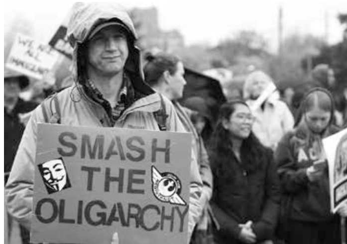
Protest gegen Oligarchie

Die wesentlichen neuen Entwicklungen lagen im Bereich dessen, was zunächst als Propaganda später dann als „public relation“ bezeichnet wurde. Zudem wurde die ideologische Rechtfertigung für die gewünschte Form der kapitalistischen Demokratie bzw. der Elitendemokratie weiter ausgearbeitet und über Medien und Erziehungswesen kulturell verankert. Besonders einflussreich waren dabei die Beiträge von Walter Lippmann, der in seinem Klassiker Public Opinion von 1922 die ideologischen Grundlagen einer verdeckt autoritären Elitendemokratie weiter ausarbeitete, wie sie dann von vielen Intellektuellen weitergeführt und zum Standardmodell einer kapitalistischen Demokratie wurde. In diesem Standardmodell wird den Bürgern die Rolle des politischen Konsumenten zugewiesen. Der „mündige Bürger“ gehört dabei ebenso zur bloßen ideologischen Rechtfertigungsrhetorik wie der „rationale Konsument“ in der Ökonomie: Beide sind tatsächlich gerade nicht erwünscht, sondern Bürger wie Konsumenten sind in ihren Einstellungen, Meinungen und Präferenzen so zu formen, dass diese mit den Interessen der jeweiligen Eliten kompatibel sind. Daher entwickelten sich politische Propaganda und Techniken des Meinungsmanagements Hand in Hand mit Techni-