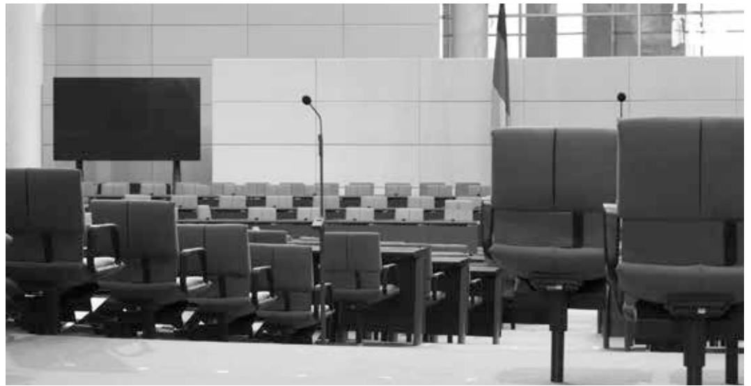
Deutscher Bundestag

te sie sich kurzzeitig als historisch singuläre Erscheinung inmitten einer Kontinuität oligarchischer und autoritärer Herrschaftsformen und der maßlosen Verachtung, die die jeweiligen „Eliten“ gegen das „gemeine Volk“ und die „Massen“ hegten. Ihren Überzeugungen nach sei das „Volk“ überwiegend unfähig, sich am Gemeinwohl zu orientieren. Danach führe die Demokratie nahezu zwangsläufig zu einer „Pöbelherrschaft“, was insbesondere daran erkennbar sei, dass die Mehrzahl der Nichtbesitzenden die Eigentumsverteilungen zu ihren Gunsten zu korrigieren suche. Die Herrschaftsform einer Demokratie sei also schon ihrem Wesen nach nicht geeignet, eine dem Gemeinwohl dienende gesellschaftliche Ordnung zu garantieren. Die Stabilität der herrschenden Eigentumsordnung sei umso gefährdeter, je mehr eine Demokratie die Form einer wirk-