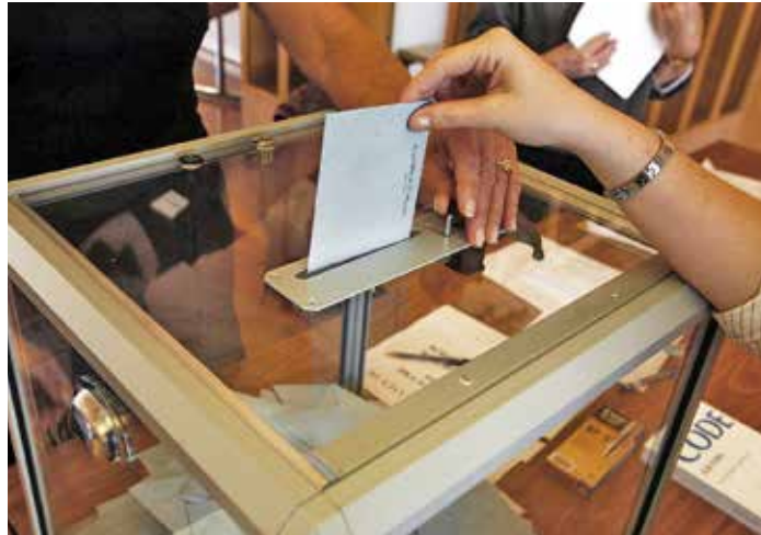
Stimmabgabe beim zweiten Wahlgang der Präsidentschaftswahl in Frankreich 2007

Der wesentliche Schritt zu dieser Bedeutungsverschiebung wurde mit der Erfindung des Modells einer „repräsentativen Demokratie“ geleistet. Die Gründerväter der amerikanischen Verfassung entwickelten mit diesem Konzept einen Demokratiebegriff, der seiner Natur nach das Modell einer wirklichen, also partizipatorischen Demokratie ausschloss. Für diese Form einer durch freie Wahlen legitimierten Oligarchie wurde die Bezeichnung Demokratie beibehalten, um das Bedürfnis des Volkes nach einer Volksherrschaft zu befriedigen – und zwar durch die Illusion einer Demokratie. Die dabei zugrunde gelegte Form von Repräsentation wurde „als ein Mittel verstanden, um das Volk von der Politik fernzuhalten“ und „eine besitzende Oligarchie mit der Unterstützung der Masse der Bevölkerung über Wahlen an der