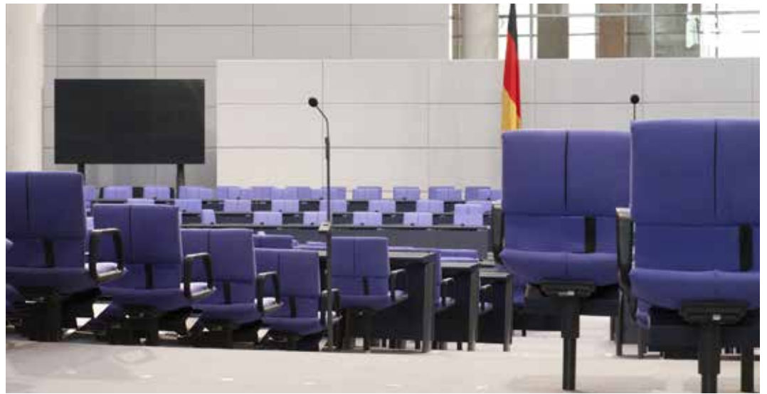
Deutscher Bundestag

te sie sich kurzzeitig als historisch singuläre Erscheinung inmitten einer Kontinuität oligarchischer und autoritärer Herrschaftsformen und der maßlosen Verachtung, die die jeweiligen „Eliten“ gegen das „gemeine Volk“ und die „Massen“ hegten. Ihren Überzeugungen nach sei das „Volk“ überwiegend unfähig, sich am Gemeinwohl zu orientieren. Danach führe die Demokratie nahezu zwangsläufig zu einer „Pöbelherrschaft“, was insbesondere daran erkennbar sei, dass die Mehrzahl der Nichtbesitzenden die Eigentumsverteilungen zu ihren Gunsten zu korrigieren suche. Die Herrschaftsform einer Demokratie sei also schon ihrem Wesen nach nicht geeignet, eine dem Gemeinwohl dienende gesellschaftliche Ordnung zu garantieren. Die Stabilität der herrschenden Eigentumsordnung sei umso gefährdeter, je mehr eine Demokratie die Form einer wirk-