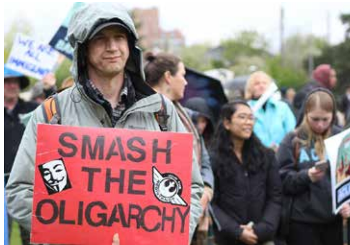
Protest gegen Oligarchie

Die wesentlichen neuen Entwicklungen lagen im Bereich dessen, was zunächst als Propaganda später dann als „public relation“ bezeichnet wurde. Zudem wurde die ideologische Rechtfertigung für die gewünschte Form der kapitalistischen Demokratie bzw. der Elitendemokratie weiter ausgearbeitet und über Medien und Erziehungswesen kulturell verankert. Besonders einflussreich waren dabei die Beiträge von Walter Lippmann, der in seinem Klassiker Public Opinion von 1922 die ideologischen Grundlagen einer verdeckt autoritären Elitendemokratie weiter ausarbeitete, wie sie dann von vielen Intellektuellen weitergeführt und zum Standardmodell einer kapitalistischen Demokratie wurde. In diesem Standardmodell wird den Bürgern die Rolle des politischen Konsumenten zugewiesen. Der „mündige Bürger“ gehört dabei ebenso zur bloßen ideologischen Rechtfertigungsrhetorik wie der „rationale Konsument“ in der Ökonomie: Beide sind tatsächlich gerade nicht erwünscht, sondern Bürger wie Konsumenten sind in ihren Einstellungen, Meinungen und Präferenzen so zu formen, dass diese mit den Interessen der jeweiligen Eliten kompatibel sind. Daher entwickelten sich politische Propaganda und Techniken des Meinungsmanagements Hand in Hand mit Techni-