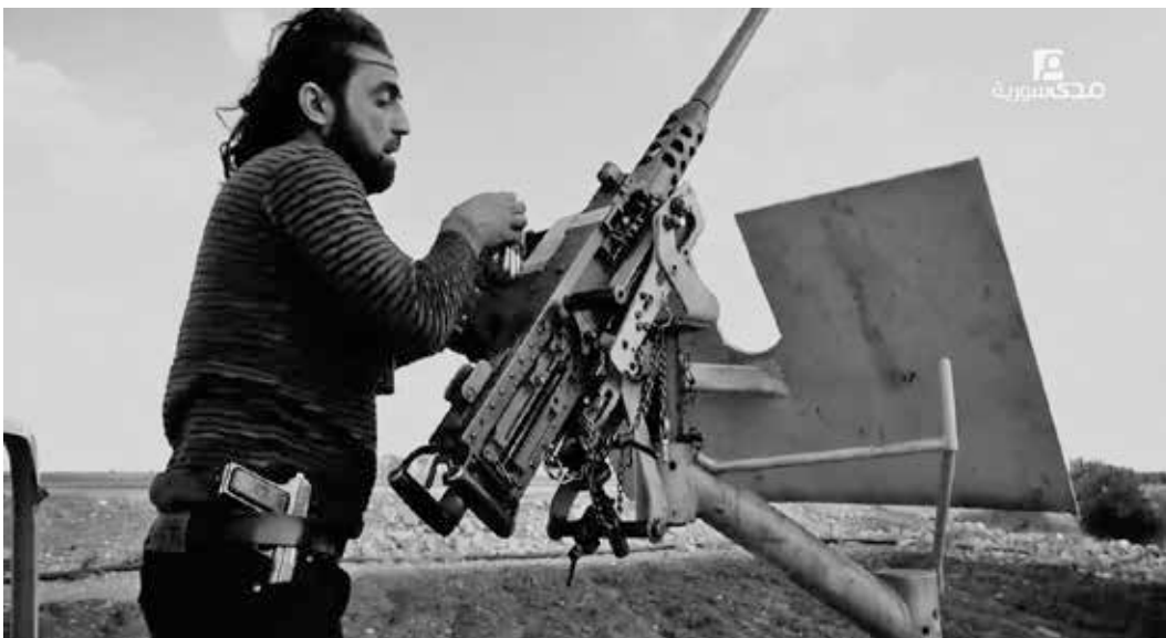
Bildtext: Ein Kämpfer der Freien Syrischen Arme lädt nördlich von Aleppo ein schweres M2-Browning-Gewehr auf einem Kampf-Fahrzeug.

Die anderen Ethnien in Syrien und in der Region, die die Kurden nun für ihren Staat beanspruchen, haben einen Föderalismus strikt abgelehnt. Eine Versammlung von arabischen Gruppen/Ethnien, die seit Jahrhunderten in der Region leben, und die Assyrische Demokratische Organisation (ADO) lehnten die Erklärung des föderalen Staates ab. In Genf lehnten sowohl die syrische Regierung als auch die „Opposition“ die Erklärung ab. Die kurdische Fraktion in der syrischen Nationalkoalition verurteilte die Föderalismuserklärung der PYD, auch weil sie in keiner Weise den Willen der Gesamtheit der kurdischen Bevölkerung in Syrien widerspiegelt. Voraussetzung für die Anerkennung wäre eine Änderung der Verfassung Syriens. 90 bis 93 Prozent der Bevölkerung sind keine Kurden und angesichts der Bedrohungen von außen will die Mehrheit der Bevölkerung nicht