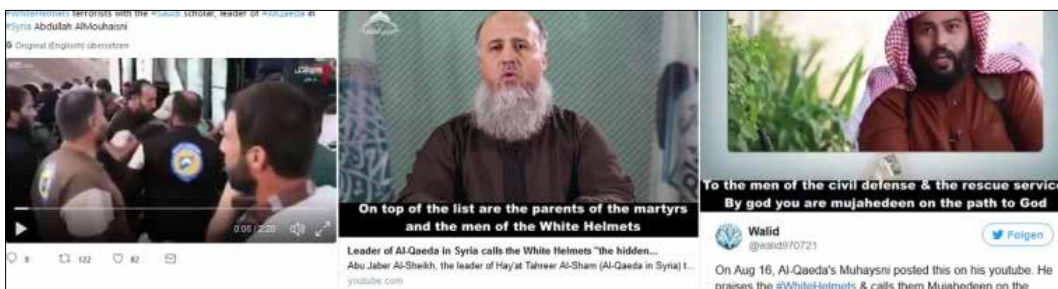
Quellen: Screenshots Twitter

Die Weißhelme nehmen auch an Folterungen von Kriegsgefangenen durch ihre Extremistenkollegen um Al Qaida teil, wie aus von den Jihadisten veröffentlichten Filmen ersichtlich ist.