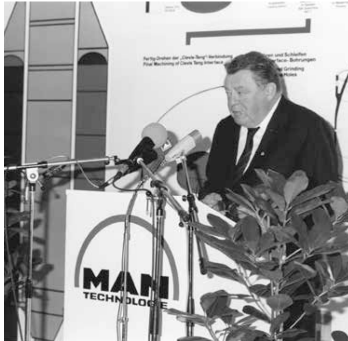
Der bayerische Ministerpräsident Franz Josef Strauß spricht bei der Eröffnung der Produktionsstätte für die Ariane 5-Boostersegmente am 30. September 1988 bei MT in Augsburg (ein Tag vor seinem Tod) Foto: Copyright MT Aerospace AG, Eröffnung Fertigung 1988 (Quelle: ESA)

1933 waren GHH und MAN nach Kräften bemüht, sich eine günstige Ausgangsposition im Rüstungsgeschäft zu sichern. Die Aussicht auf umfangreiche Erträge des Heeres, der Marine und der Luftwaffe ließ die Nachteile in den Hintergrund treten, die sich aus der nationalsozi-